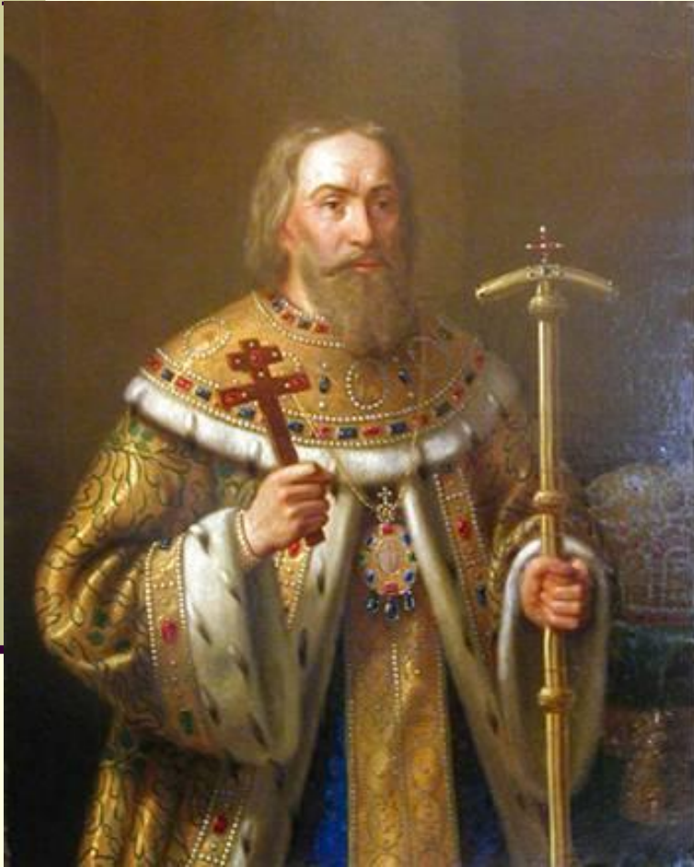
Н. Тютрюмов. Портрет патриарха Филарета.

Церковь, как и остальное население, разделилось на две части: