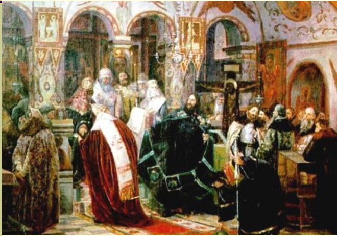
Лишение Никона на Соборе Патриаршего сана. Неизвестный художник. (19 век).