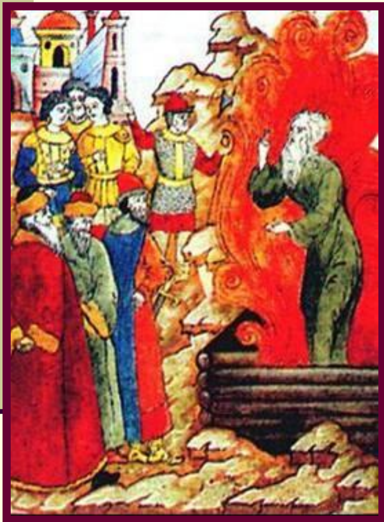
Сожжение протопопа Аввакума. Миниатюра к.17 в.

Главой старообрядцев стал протопоп Аввакум.