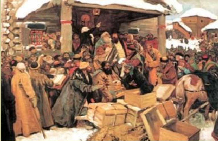
А. Иванов. Во времена раскола