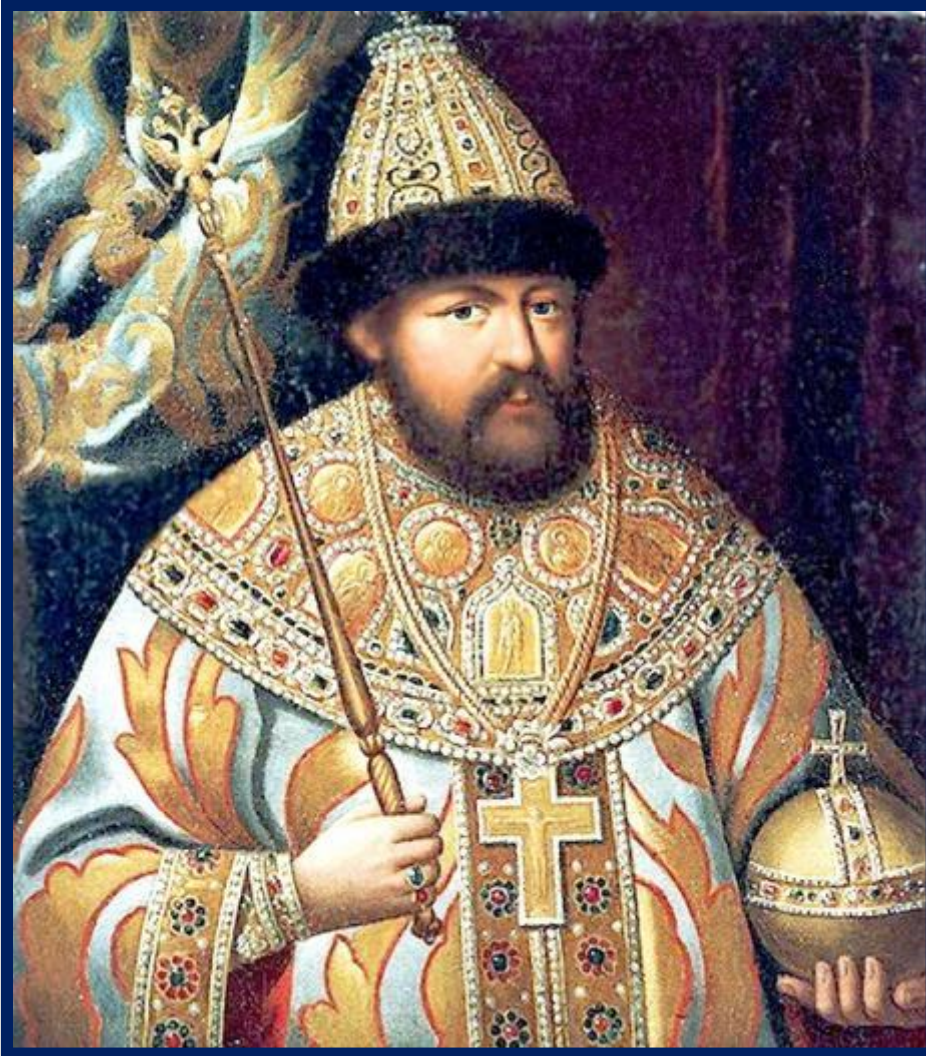
Алексей Михайлович Романов