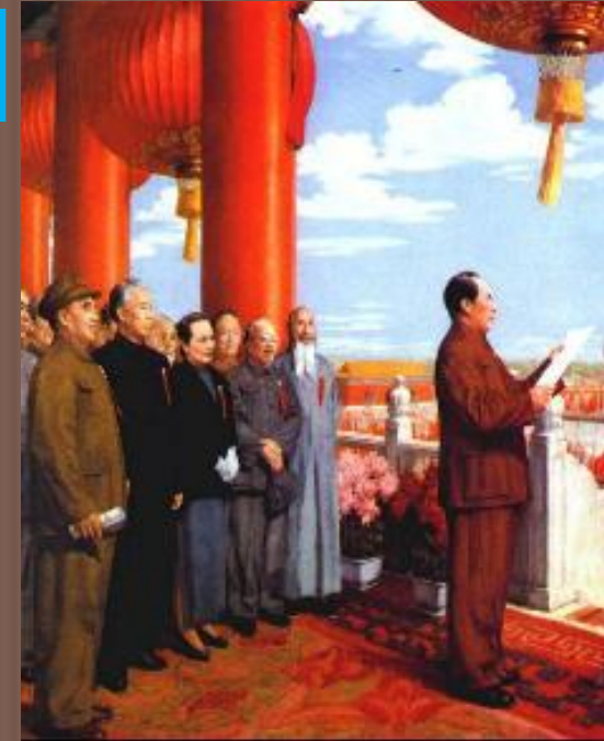
Мао Цзэдун провозглашает КНР