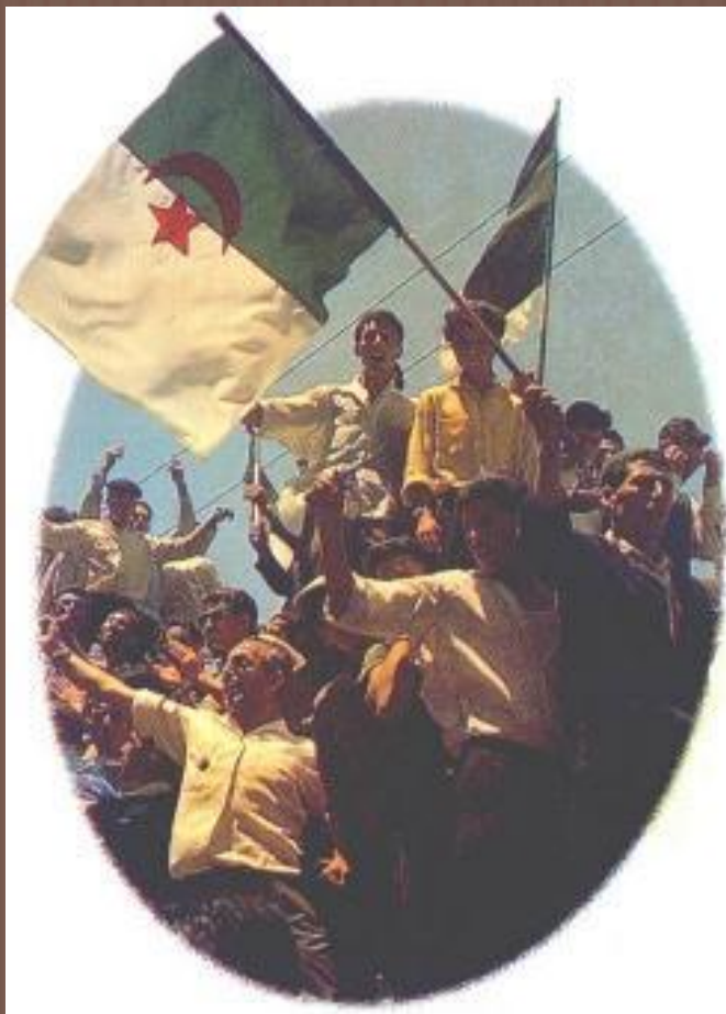
Провозглашение независимости Алжира

1954-1962 гг. – победив в вооруженной борьбе Францию, провозгласил независимость Алжир.