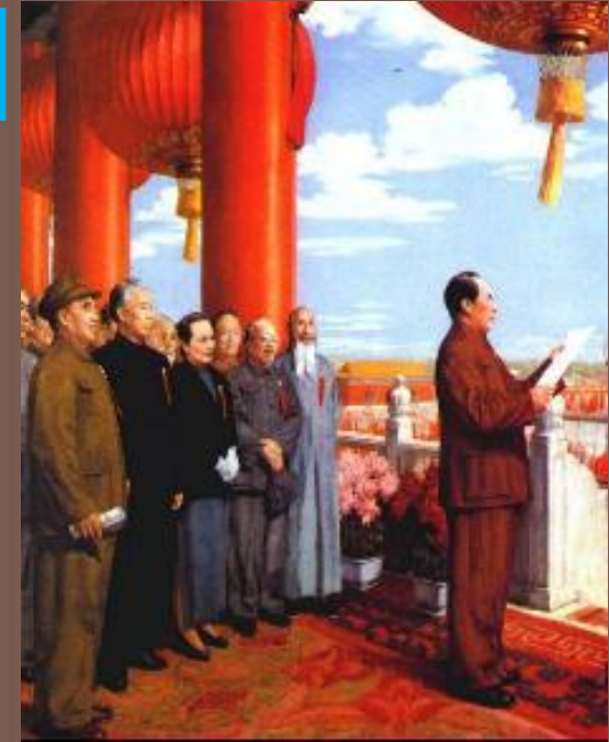
Мао Цзэдун провозглашает КНР

1 октября 1949г. образовалась Корейская Народная республика (КНР).