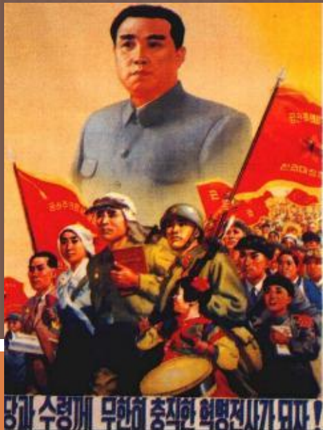
Плакат в поддержку Ким Ир Сена.