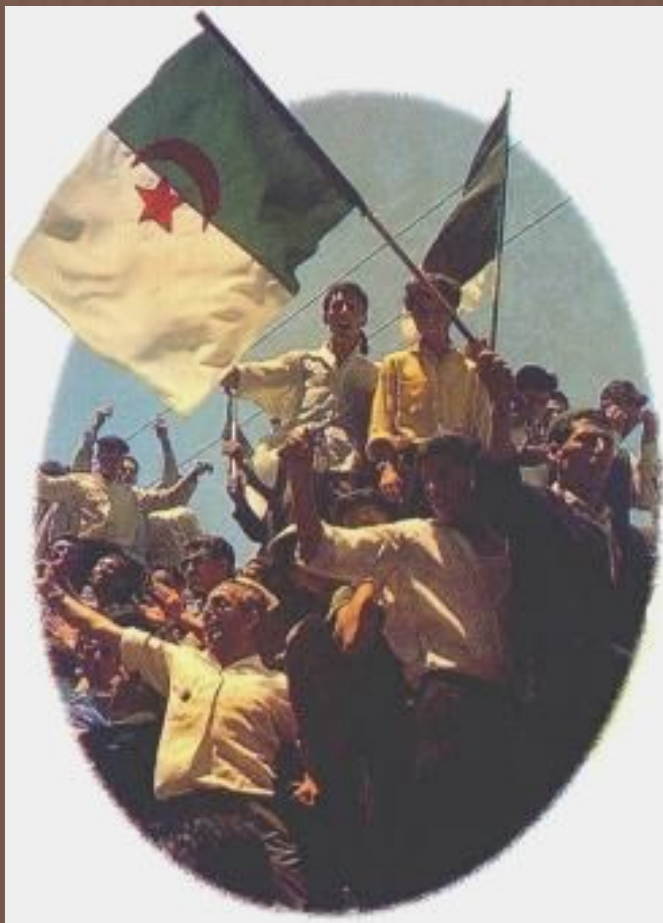
Провозглашение независимости Алжира

1954-1962 гг. – победив в вооруженной борьбе Францию, провозгласил независимость Алжир.