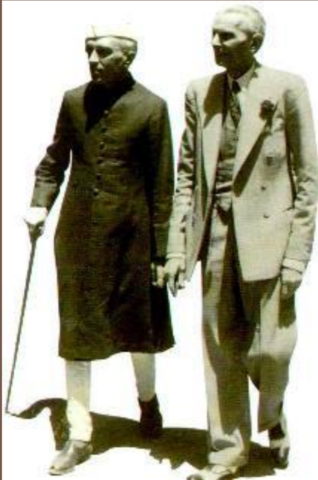
Дж.Неру и лидер Пакистана Джинни

В 1946 г. после восстания в Бомбее победу на выборах в парламент одержал ИНК.