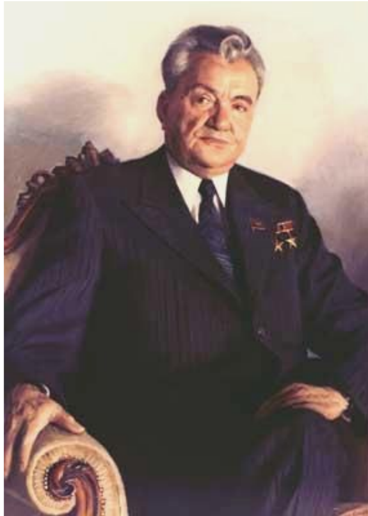
Д.А.Кунаев-1-й секретарь ЦК компартии Казахстана.

Демократизация общества привела к обострению межнациональных проблем. В н.1986 г.в Якутии студенты устроили демонстрацию под лозунгом «Якутия-для якутов». В декабре прошли массовые беспорядки в Казахстане вызванные заменой на посту 1 секретаря ЦК Д.Кунаева на Г.Колбина. Серьезное недовольство в Узбекистане вызвало расследование коррупции среди национального руководства. Наиболее остро национальный вопрос встал в Закавказье.