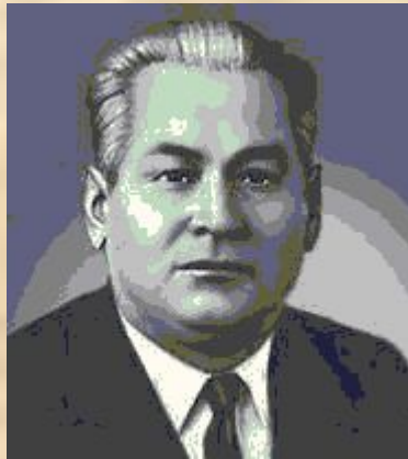
Генсек ЦК КПСС 1984-1985 К.У.Черненко