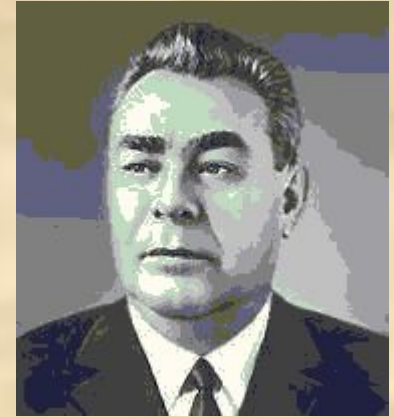
Генсек ЦК КПСС 1964-1982 Л.И.Брежнев