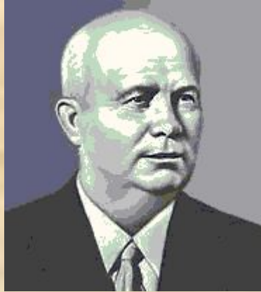
1-й секретарь ЦК КПСС 1953-1964 Н.С.Хрущев