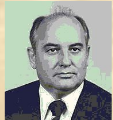
Генсек ЦК КПСС 1985-1991, Президент СССР 1990-1991 М.С.Горбачев