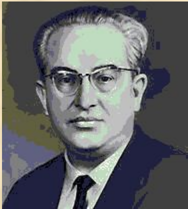
Генсек ЦК КПСС 1982-1984 Ю.В.Андропов