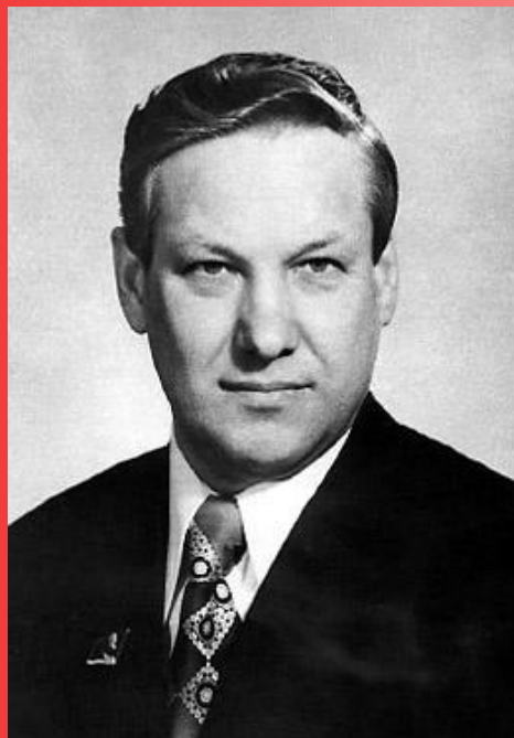
Б.Н. Ельцин (фотография 1970-х годов)

Б.Н. Ельцин родился 1-го февраля 1931 года в трудовой семье. Получил высшее строительное образование, работал на руководящих постах. В 1976 году занял должность первого секретаря Свердловского обкома, а затем стал членом ЦК КПСС. В октябре 1987 года был снят со всех постов из-за своих демократических убеждений. Спустя два года Ельцин был избран народным депутатом СССР и членом Верховного Совета. 12-го июня 1991 года состоялись выборы Президента РСФСР. Главой государства стал Б.Н. Ельцин.