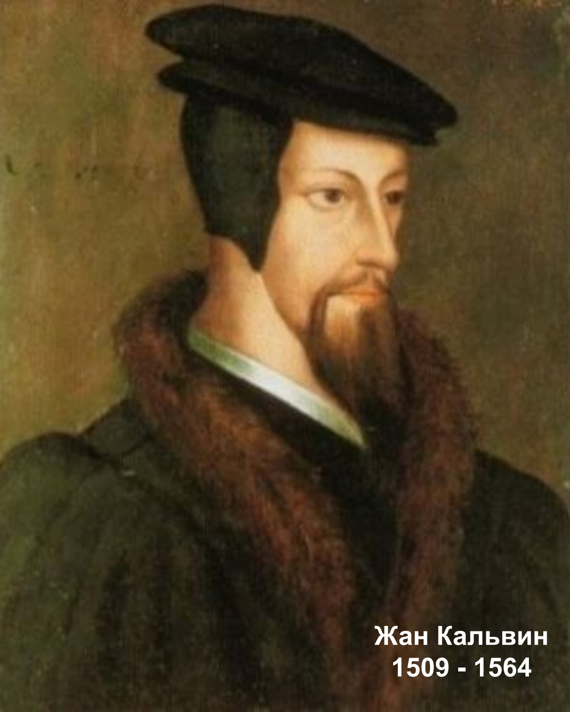
Жан Кальвин 1509 - 1564