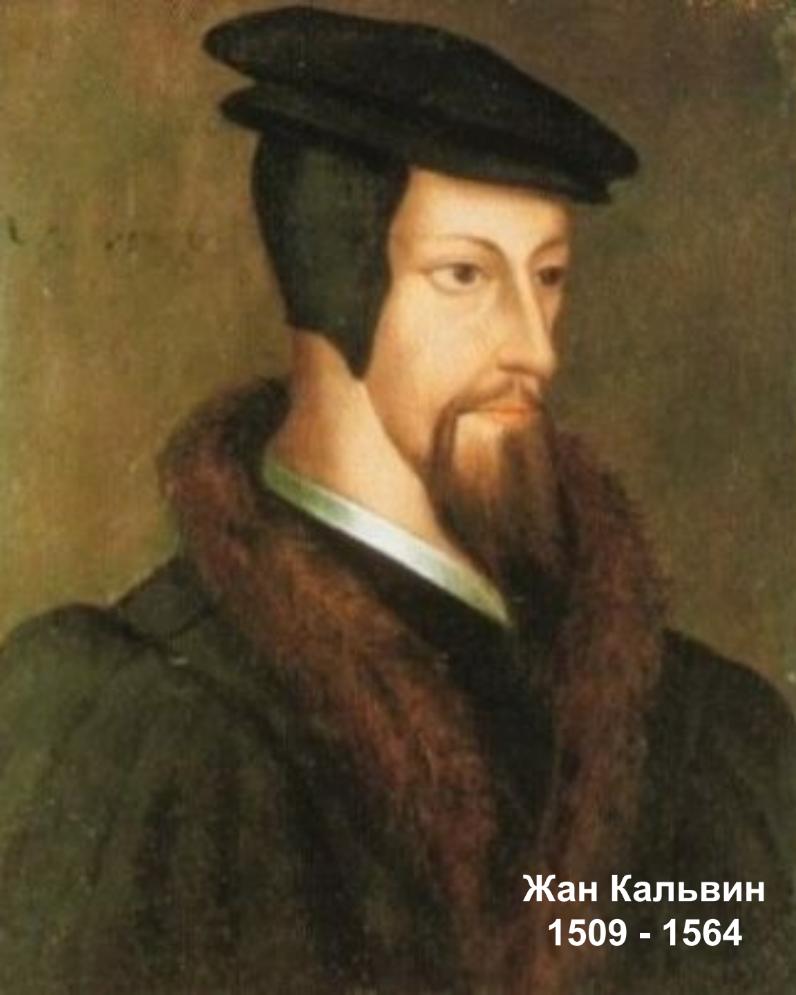
Жан Кальвин 1509 - 1564