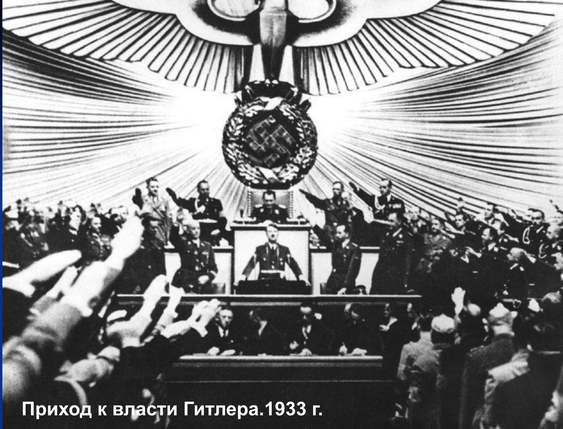
Приход к власти Гитлера. 1933 г.