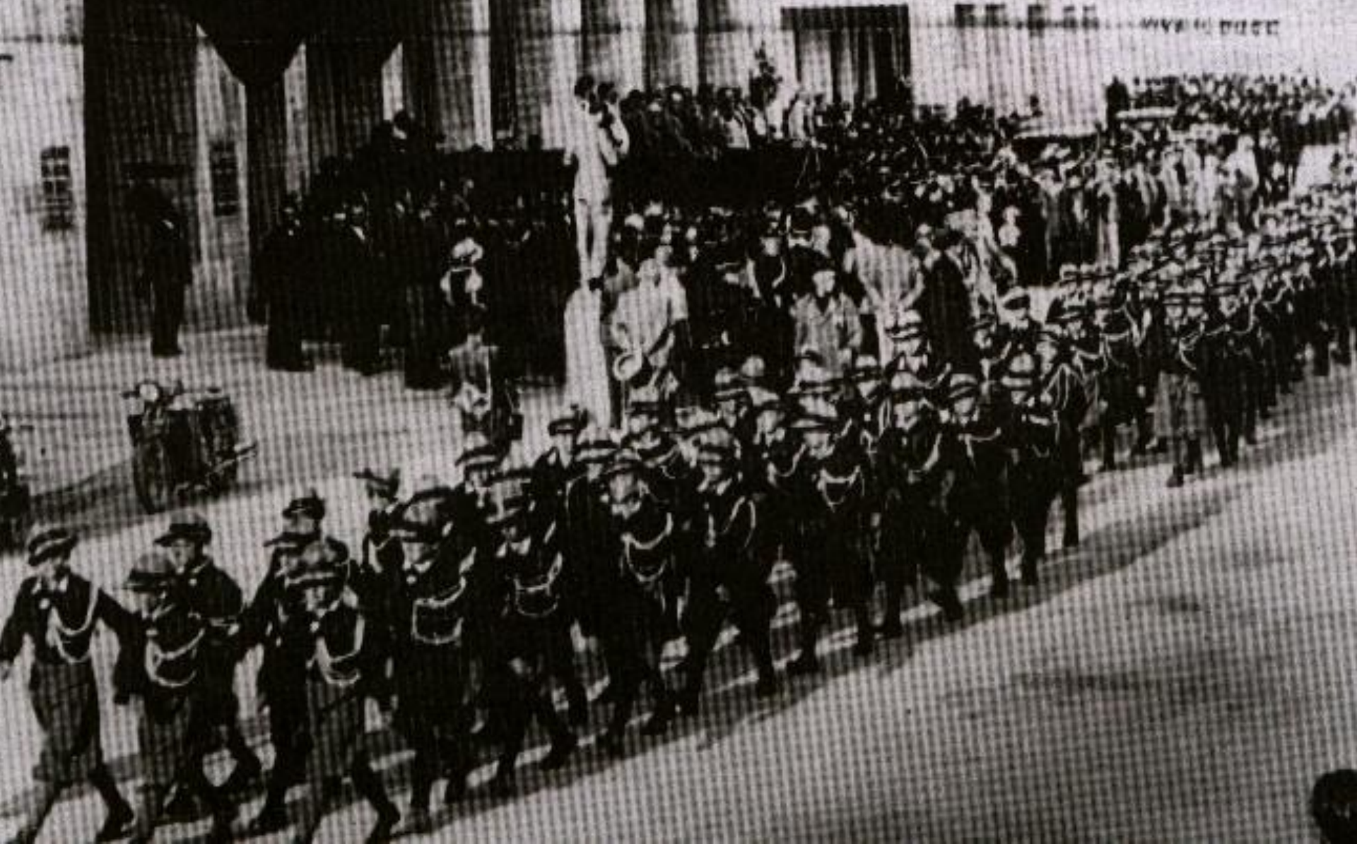
Парад фашистской молодежной организации. Рим. 1929г.