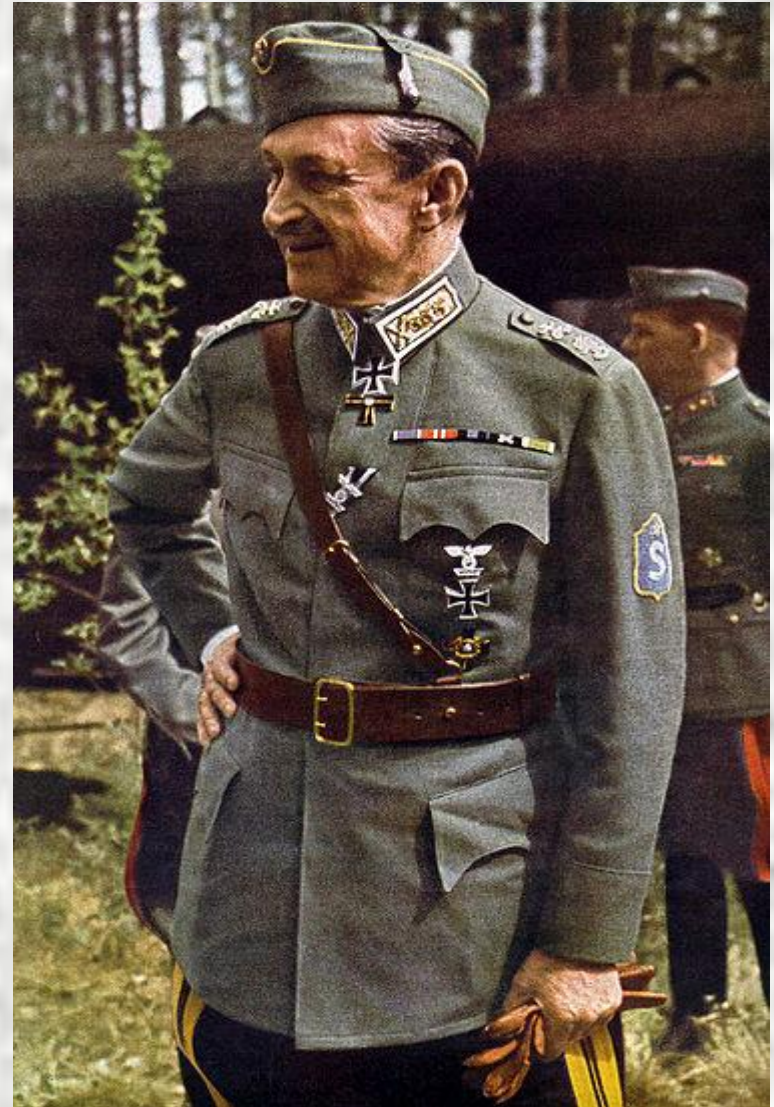
фото 1942 г.