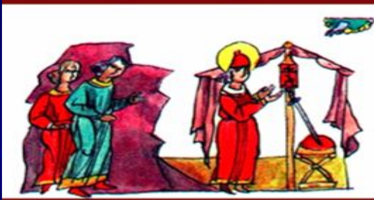
Князь Глеб молится перед смертью.