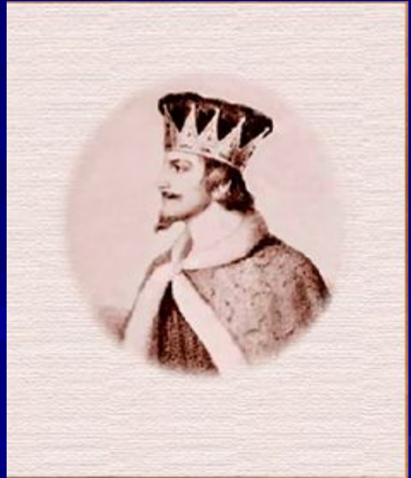
Святополк I Окаянный.