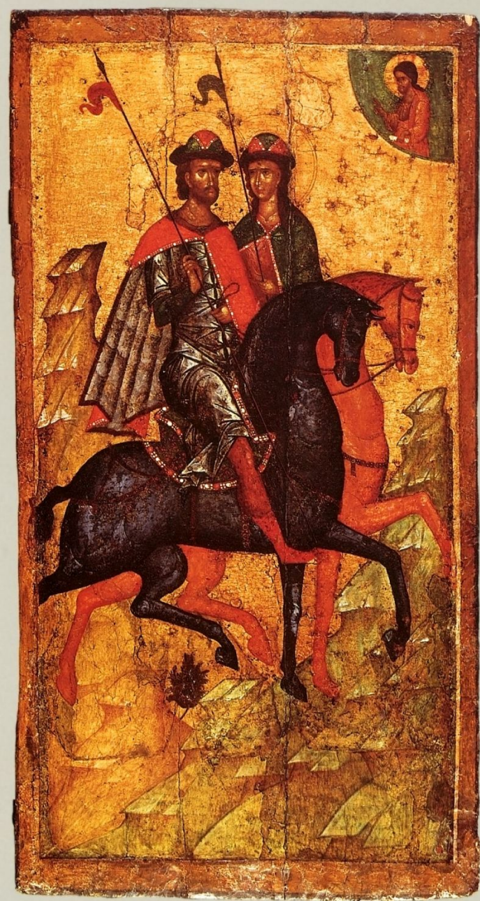
Свв. Борис и Глеб. Икона XIV в.