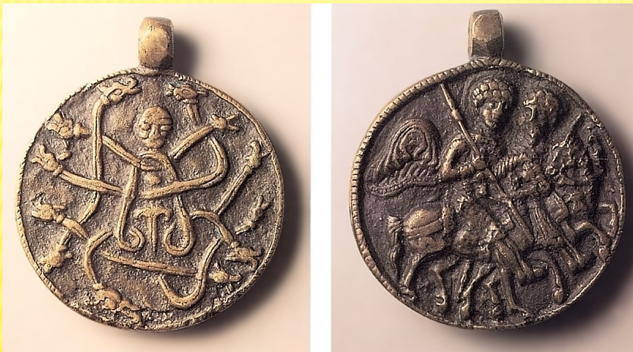
Змеевик времен Ярослава Мудрого