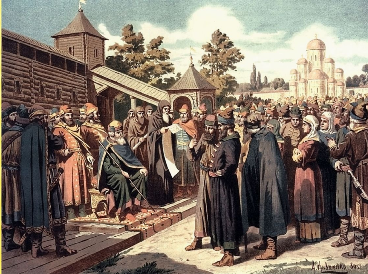
Ярослав Мудрый. Чтение народу