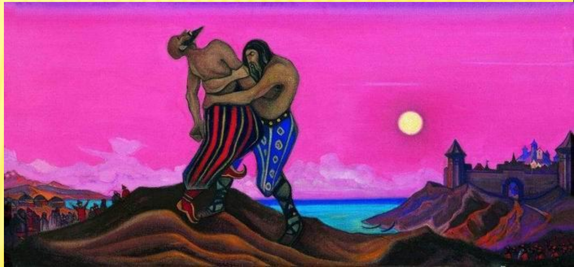
Н.К. Рерих расцвета Древней Руси Единоборство Мстислава с Редедей