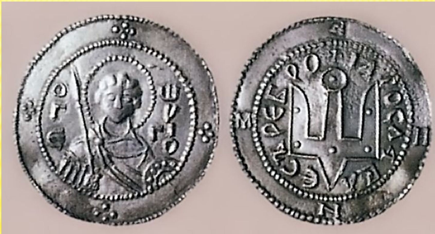
Монета времен Ярослава Мудрого