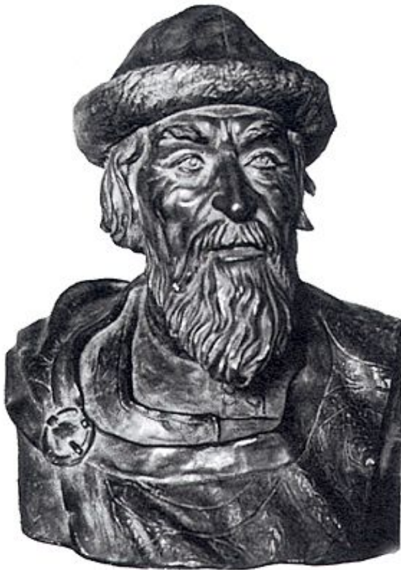
М.М. Герасимов Ярослав Мудрый Реконструкция. 1939