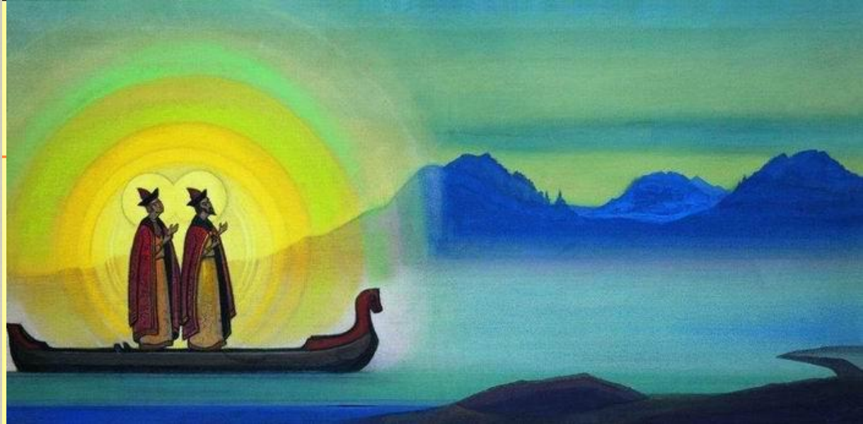
Н.К. Рерих Святые Борис и Глеб