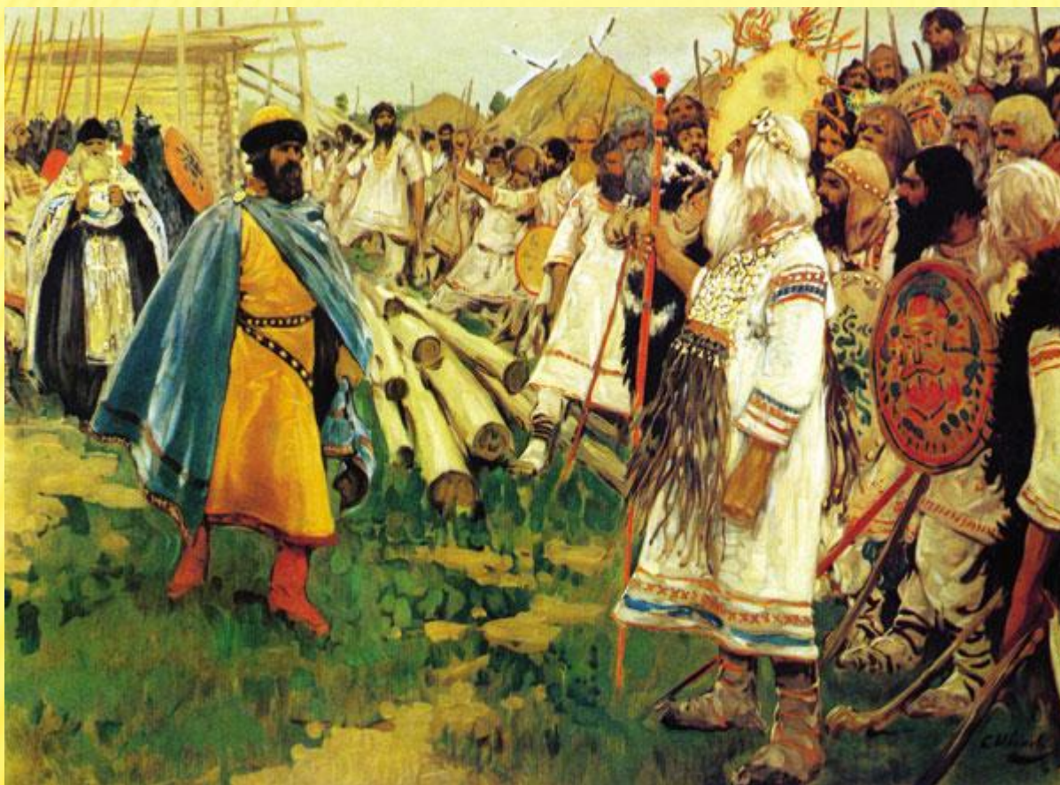
С. Иванов Христиане и язычники