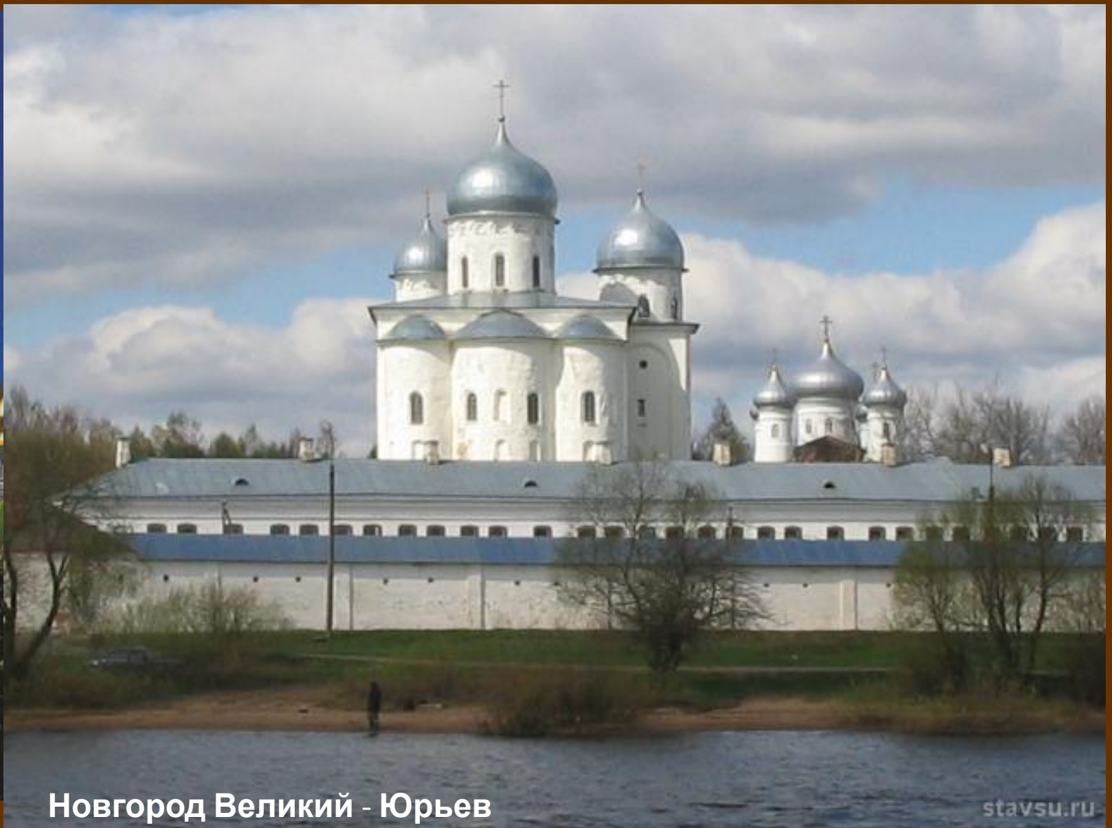
Новгород Великий - Юрьев монастырь