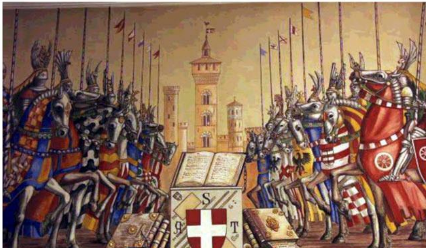
Гвельфы и гибеллины