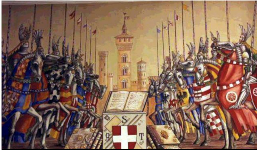
Гвельфы и гибеллины