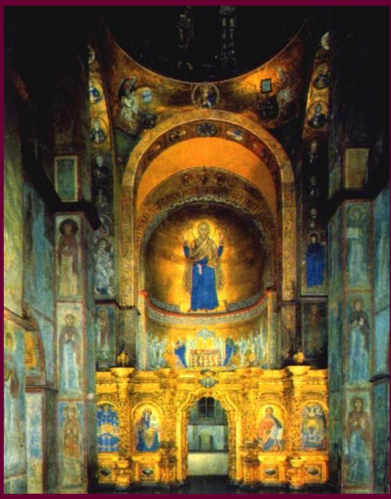
Интерьер собора Святой Софии в Киеве

Внутренне убранство храма отличалось богатой росписью. Вслед за Византией русские художники использовали в храмах синие и розовые оттенки.