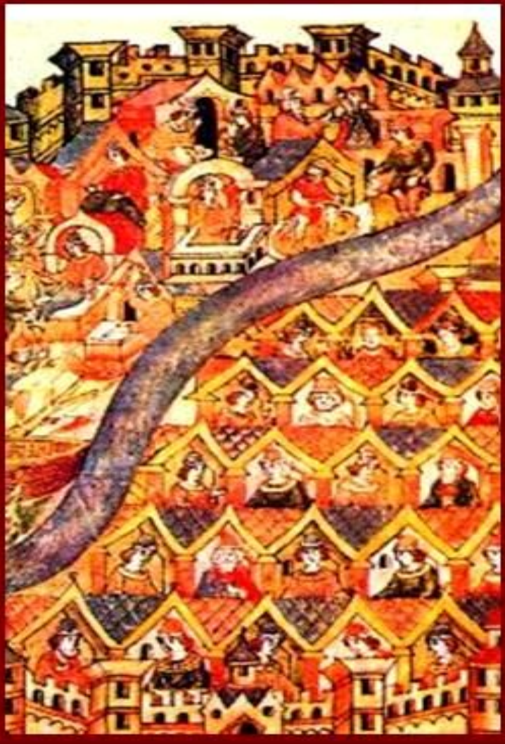
Древний Киев. Миниатюра 17 в.

Несмотря на кажущееся единство Киевской Руси, отдельные ее территории пользовались большой самостоятельностью.