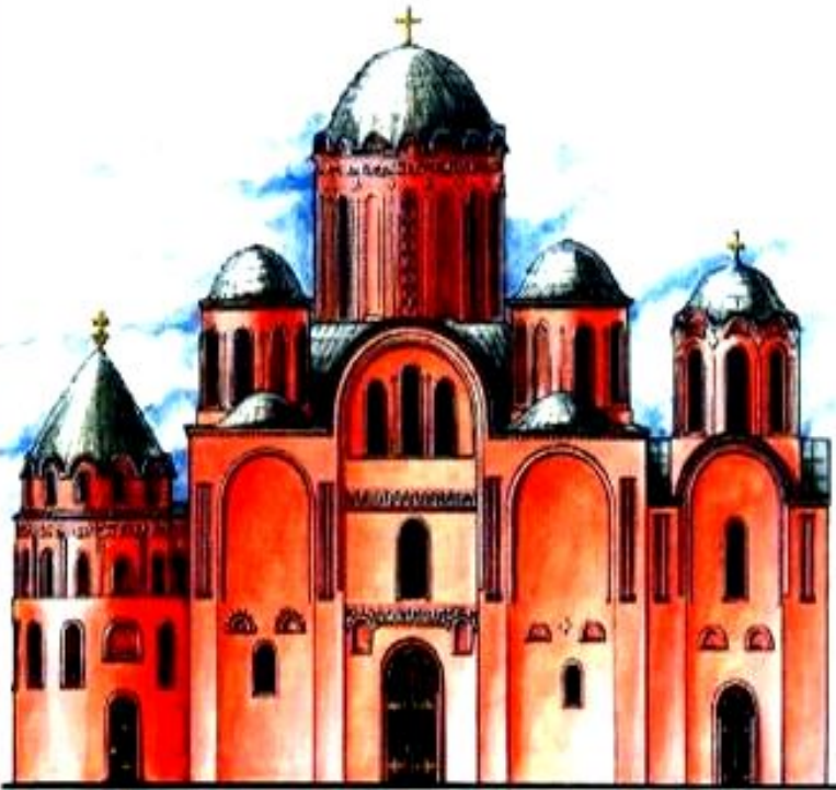
Спасо-Преображенский собор в Чернигове. Реконструкция.

В Киевской Руси стали появляться каменные постройки-церкви и соборы.