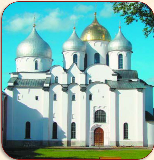
Софийский собор в Новгороде

Повышенный уровень. Приведи доказательства того, что в государственной и культурной жизни Русь Ярослава Мудрого соперничала с Византийской империей.