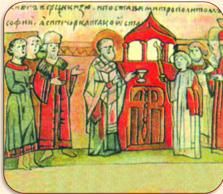
«Поставление Илариона на митрополию»