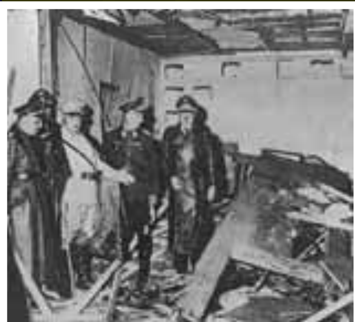
Ставка Гитлера 20 июля 1944 г.

В августе 1944 г. началось Словацкое национальное восстание. Немцам удалось остановить наступление советских войск и восстание было подавлено. Несмотря на эти успехи в Германии многие осознавали неизбежность поражения.