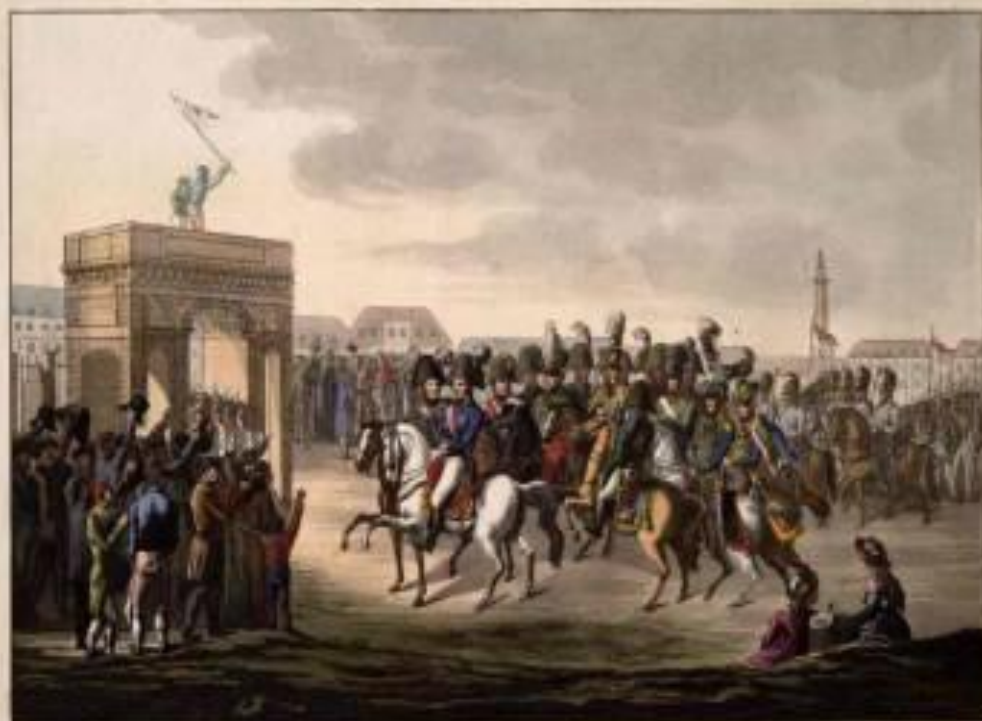
ИМПАТОРСКОЕ ВХОЖДЕНИЕ ЦАРЯ АЛЕКСАНДРА ПЕРВОГО И ЕГО ВОЙСКИ В ПАРИЖ.

31 марта 1814 года войска коалиции вошли в Париж . Верхом на белом коне ехал русский император Александр I.