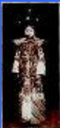
Наложница и последняя императрица Китая Гу И в свадебном наряде. Фото начала XX в.

Несмотря на большое количество погибших в результате атомной бомбардировки (140000 человек в Хиросиме и 80000 в Нагасаки), японское руководство полагало, что сможет противостоять вторжению войск антигитлеровской коалиции, если удержит контроль над Маньчжурией и Кореей, поставлявшими ресурсы для ведения войны, считают Хасегава и Терри Чарман, сотрудник Императорского военного музея в Лондоне, специализирующийся на истории Второй мировой войны. «Удар советских войск всё изменил», заявил Чарман. «Власти в Токио поняли, что никаких надежд не осталось. Таким образом, операция «Августовская буря» в гораздо большей степени повлияла на решение Японии о капитуляции, чем атомная бомбардировка».