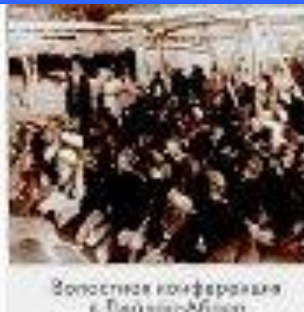
Восточная конференция в Делавэ-Альберт