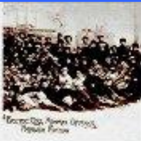
Делегаты В. Дальневосточного совета Коммунистической организации народов Востока