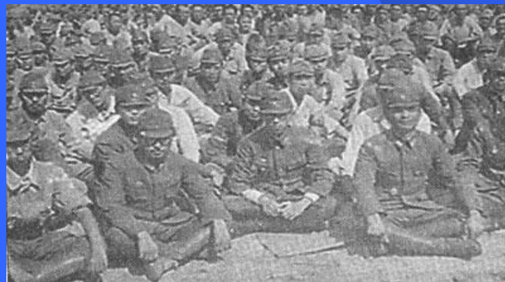
Японские военнопленные. 1945г.