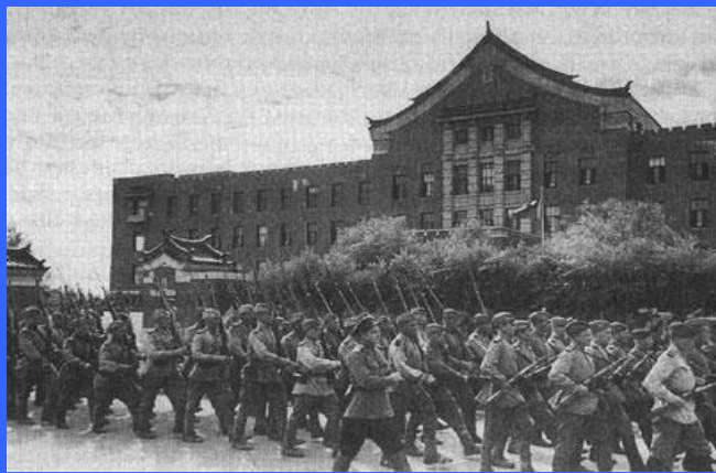
Советские войска в Китае. 1945г.

Во взаимодействии с десантами Тихоокеанского флота они овладели северокорейскими портами Унги, Наджин, Чхонджин, Вонсан. Японские войска оказались отрезанными от метрополии. Одновременно войска фронта вели наступление на Харбин и Гирин, ведя бои по ликвидации отдельных группировок противника, продолжавших сопротивление. Для скорейшего освобождения Харбина, Гирина, Пхеньяна и других городов с 18 по 24 августа в них были высажены воздушные десанты. Войска 2-го Дальневосточного фронта во взаимодействии с Амурской военной флотилией форсировали Амур и Уссури и в течение трех дней очистили от противника все правобережье Амура. После этого они прорвали долговременную оборону противника в районах Хэйхэ и Фуцзиня и затем развернули наступление в глубь Маньчжурии. Преодолев к 20 августа горный хребет Малый Хинган, передовые отряды фронта развивали наступление на Цицикар. 20 августа соединения 15-й армии вступили в Харбин, уже занятый советским воздушным десантом и моряками Амурской флотилии. К 20 августа советские войска, продвинувшись в глубь Северо-Восточного Китая от 200-300 км с востока и севера до 400- 800 км - с запада, вышли на Маньчжурскую равнину, окружили и расчленили японскую группировку на несколько изолированных частей. С 19 августа японские войска начали в массовом порядке сдаваться в плен.