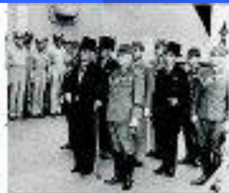
Подписание Акта о капитуляции Японии 2 сентября 1945 г., лайкер «Миссури»