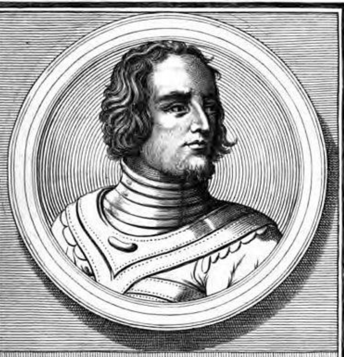
ALARICO SEGUNDO REY DE LOS GOTOS, ELEGIDO EN EL AÑO 382 D CHRISTO, REYNÓ 28 AÑOS MURIÓ EN CA- LABRIA EL AÑO 410.

Мечтая завладеть сокровищами Рима, Аларих, вождь германского племени готов двинул свои войска на Рим. К ним стали присоединяться рабы и колонны, показывали готам тайники, где римляне прятали хлеб и оружие.