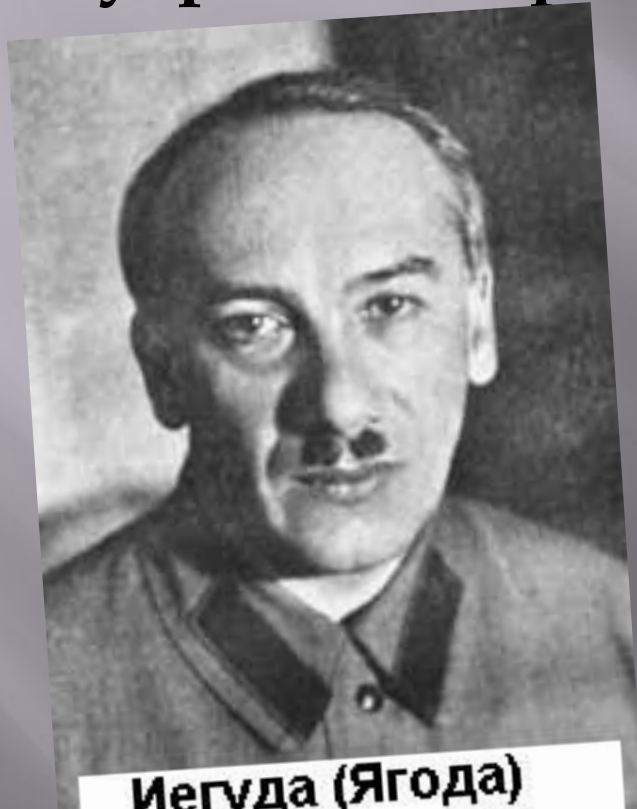
Иегуда (Ягода) Генрих Гиршевич. Нарком внутренних дел СССР в 1934-1936 гг.

Репресивно-каральними органами були – Об'єднане державне політичне управління (ОДПУ 1922-1934 рр.) та Народний комісаріат внутрішніх справ (НКВС 1934-1941 рр.)