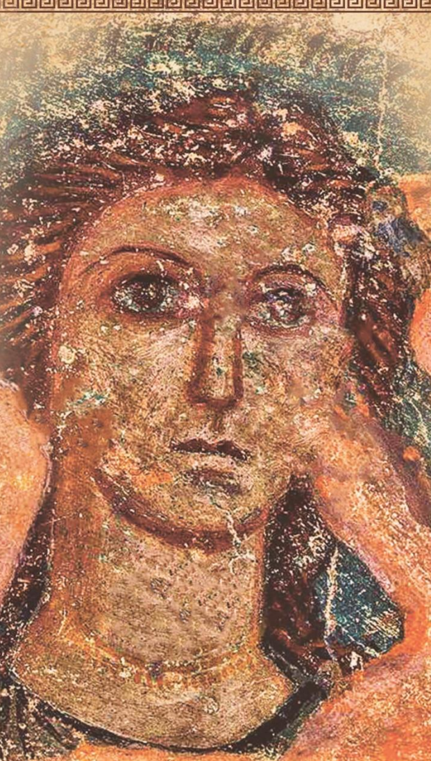
РОСПИСЬ ЦЕНТРАЛЬНОГО ПЛАФОНА СКЛЕПА ДЕМЕТРЫ

Мы ждем Вас в самом центре города у подножья Большой Митридатской лестницы, под левым ее сводом.