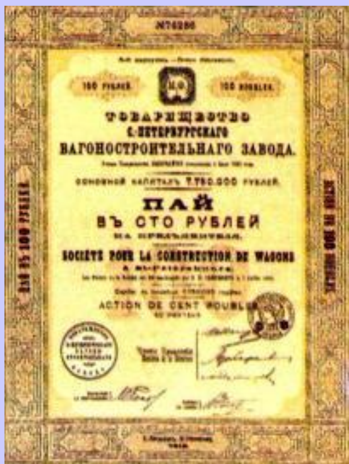
Акция вагоностроительного завода

Развитие банков оказа- лось тесно связано со строительством желе- зных дорог. Это объяс- нялось: