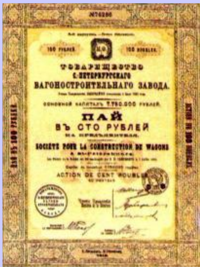
Акция вагоностроительного завода

Развитие банков оказа- лось тесно связано со строительством желе- зных дорог. Это объяс- нялось: