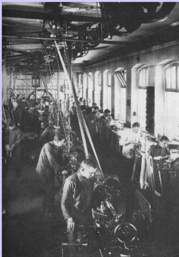
В цехе завода Г.Пека в Петербурге.

Быстрыми темпами развивалась текстильная промышленность. Владельцы мануфактур покупали земли в Ср. Азии и начали выращивать там хлопок. За 30 лет производство текстиля выросло в 30 раз. На Юге успехов достигла свеклосахарная промышленность (рост в 6 раз).