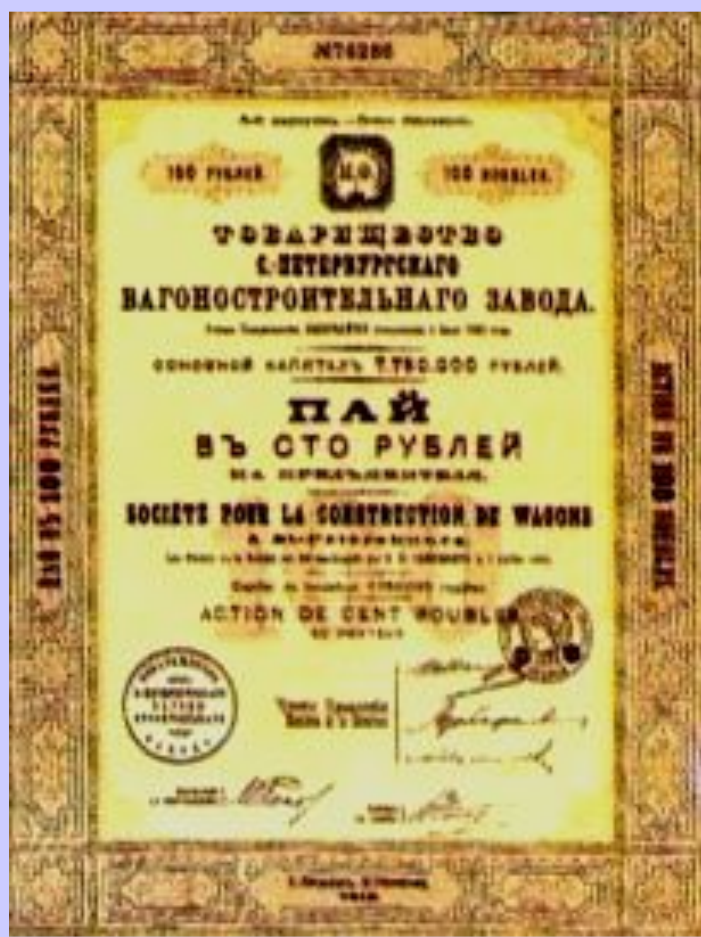
Акция вагоностроительного завода

Развитие банков оказа- лось тесно связано со строительством желе- зных дорог. Это объяс- нялось: