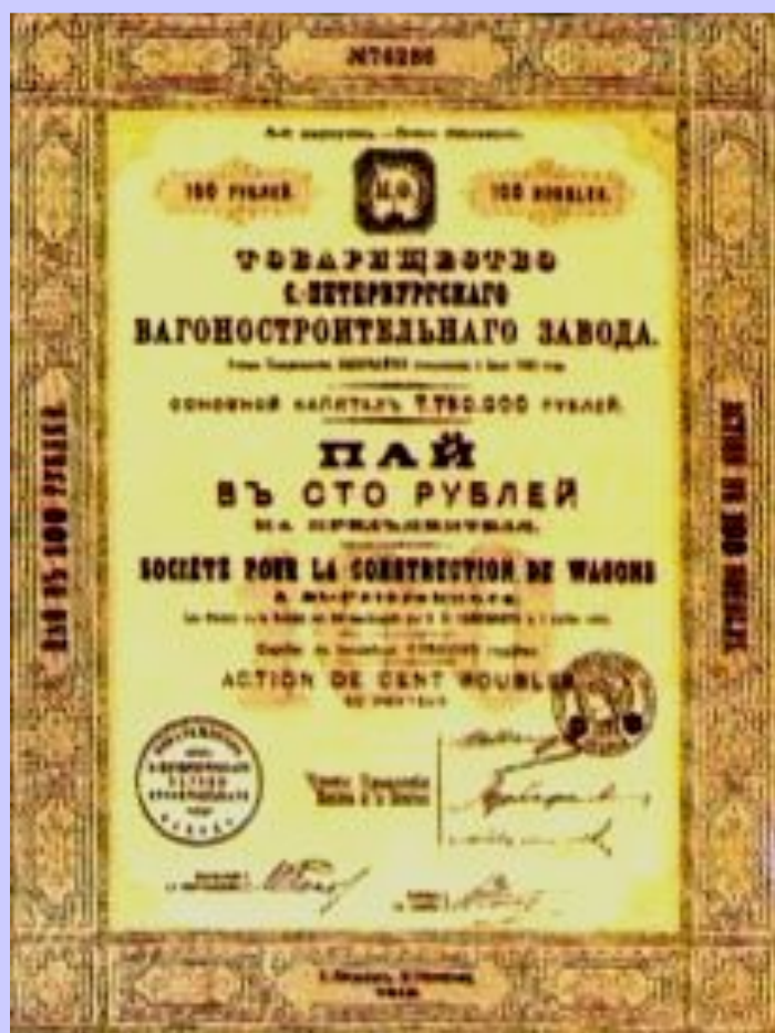
Акция вагоностроительного завода

Развитие банков оказа- лось тесно связано со строительством желе- зных дорог. Это объяс- нялось: