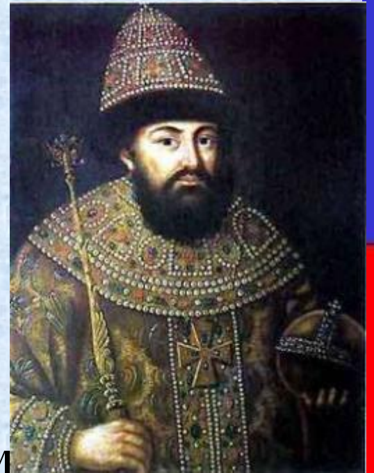
Царь Миколай I