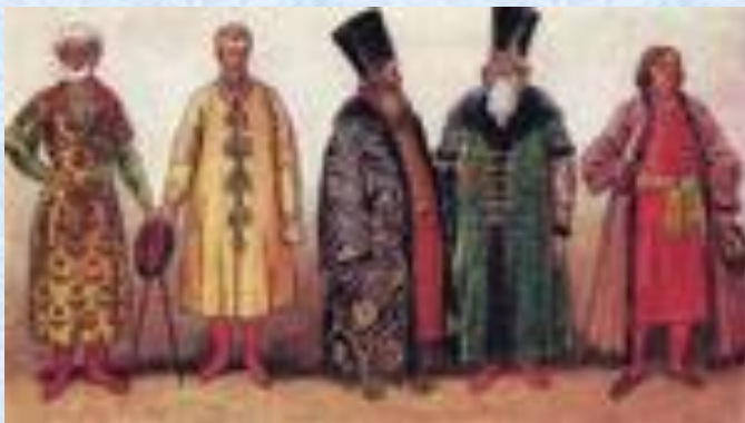
Бояре. 17 век.