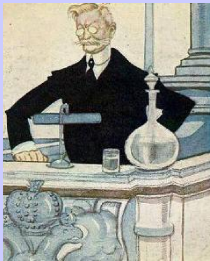
Шарж на П.Н.Милюкова

Временное правительство не стремилось решать задачи стоящие перед страной. 18 апреля Милюков обратился с нотой к союзникам России и заявил о готовности продолжать войну. Это вызвало взрыв возмущения. В столице начались антивоенные и антиправительственные демонстрации. Правительство начало наступление на фронте, но оно провалилось. 5 мая был сформирован 2 состав Временного правительства.