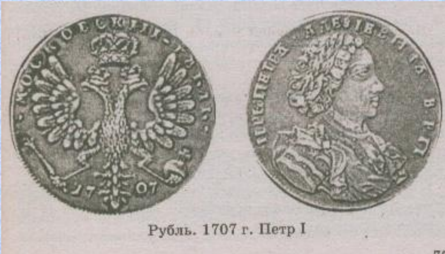
Рубль. 1707 г. Петр I