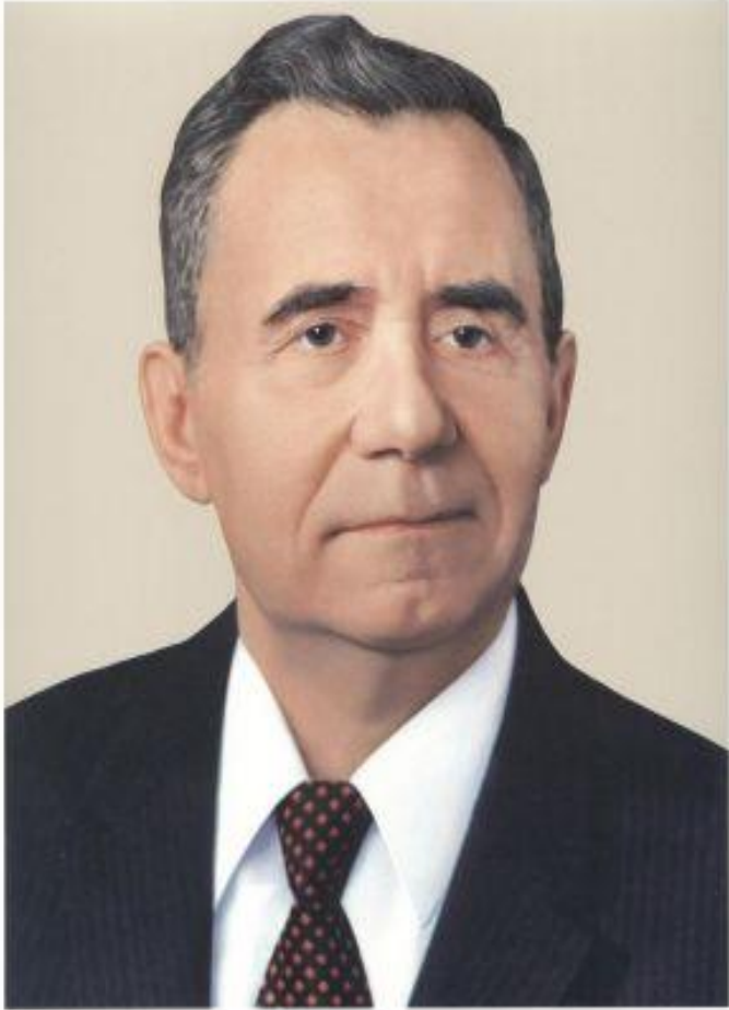
Андрей Андреевич Громыко, Министр иностраннх дел СССР (1957-1985)