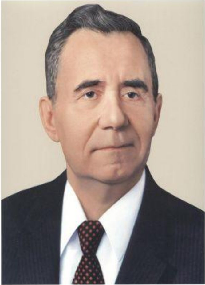
Андрей Андреевич Громыко, Министр иностраннных дел СССР (1957-1985)