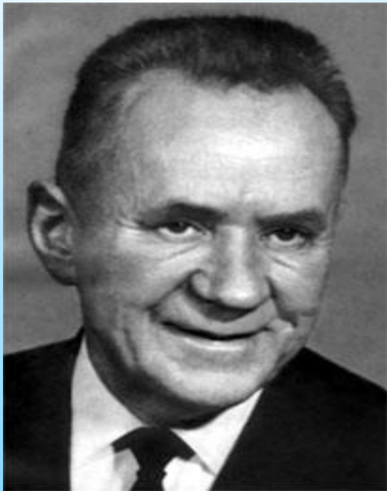
А.Н.Косыгин, председатель Совета Министров СССР 1964-1980 гг.

Суть экономической реформы 1965 г.: децентрализация народно-хозяйственного планирования, повышение роли интегральных показателей экономической эффективности (прибыль, рентабельность) и увеличение самостоятельности предприятий.