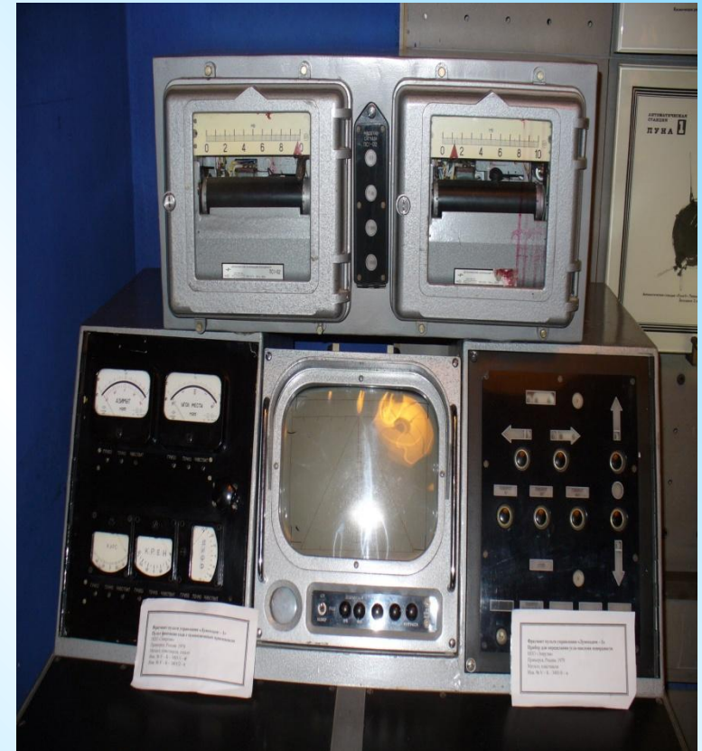
Пульт дистанционного управления Луноходом