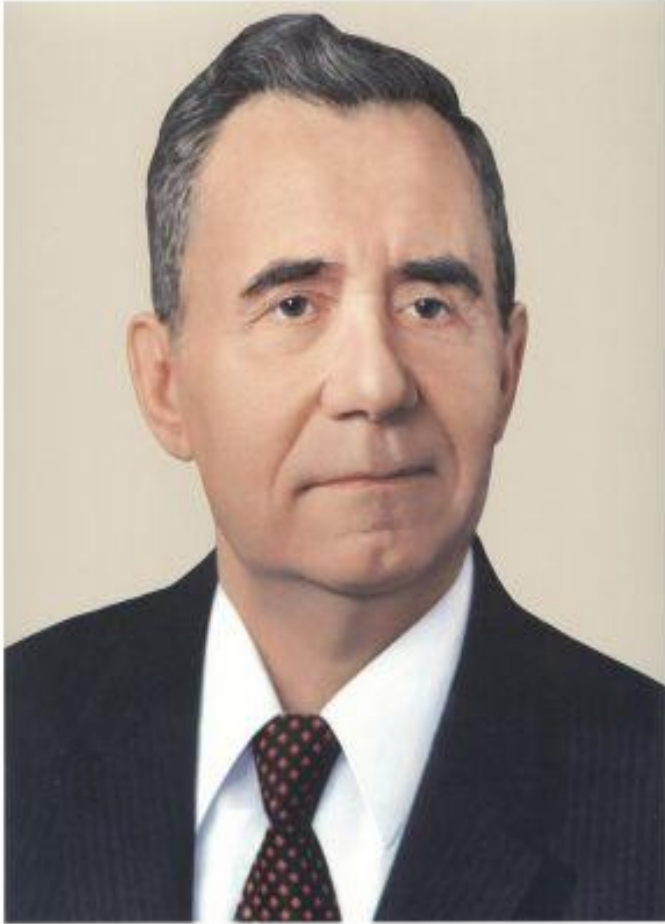
Андрей Андреевич Громыко, Министр иностраннных дел СССР (1957-1985)