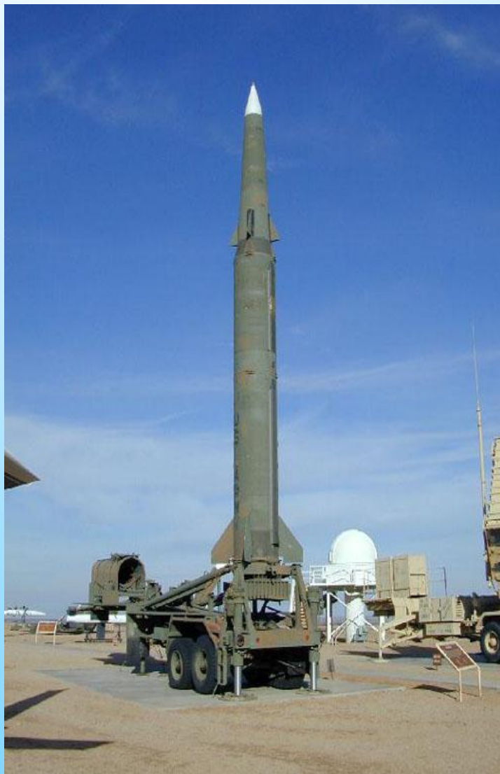
Баллистическая ракета средней дальности "Першинг-2"

После развертывания первых американских ракет "Першинг-2" в Европе в ноябре 1983 г., советский лидер Ю.В. Андропов заявил, что СССР отменяет мораторий на развертывание ядерных вооружений средней дальности и ускоряет процесс размещения тактических ракет в ГДР и Чехословакии.