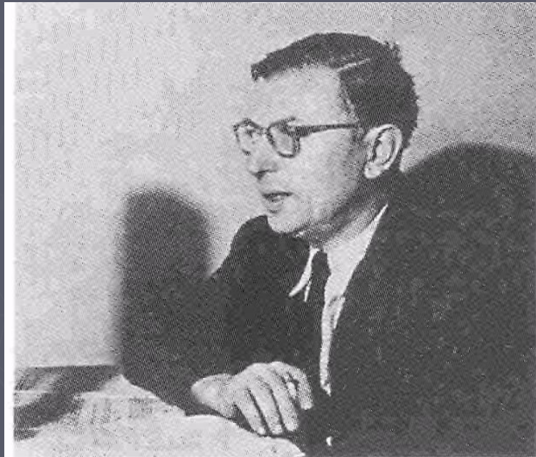
Жан Поль Сартр