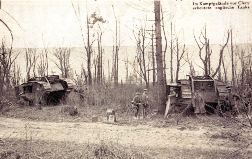
Im Kampfgelände vor Clery erbeutete englische Tanks