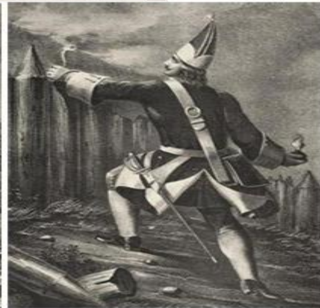
Гренадер пехотного полка