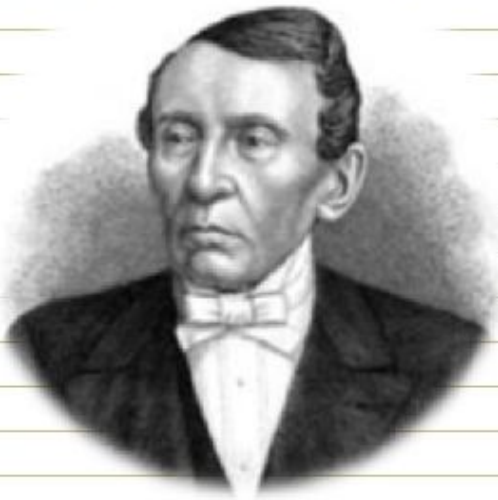
А.В. Головнин – министр просвещения (1861 – 1866 гг.)

Университетская реформа была первой после отмены крепостного права. Новый университетский устав был принят в 1863 году. Инициатором нового устава стал министр просвещения Головнин.