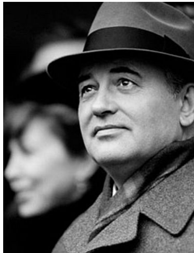
Михаил Сергеевич Горбачев