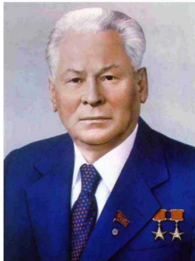
Константин Устинович Черненко

Его признанным лидером стал все более быстро набиравший политический авторитет М. С. Горбачев , бывший при Черненко вторым человеком в партии