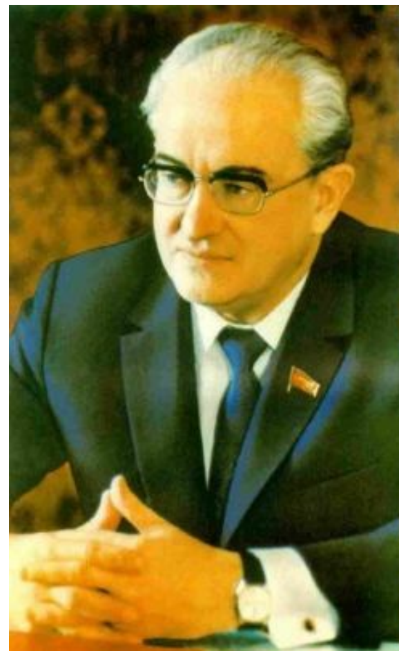
Юрий Владимирович Андропов

Деятельность Андропова была встречена в народе с симпатией, зародила в людях надежду на перемены к лучшему