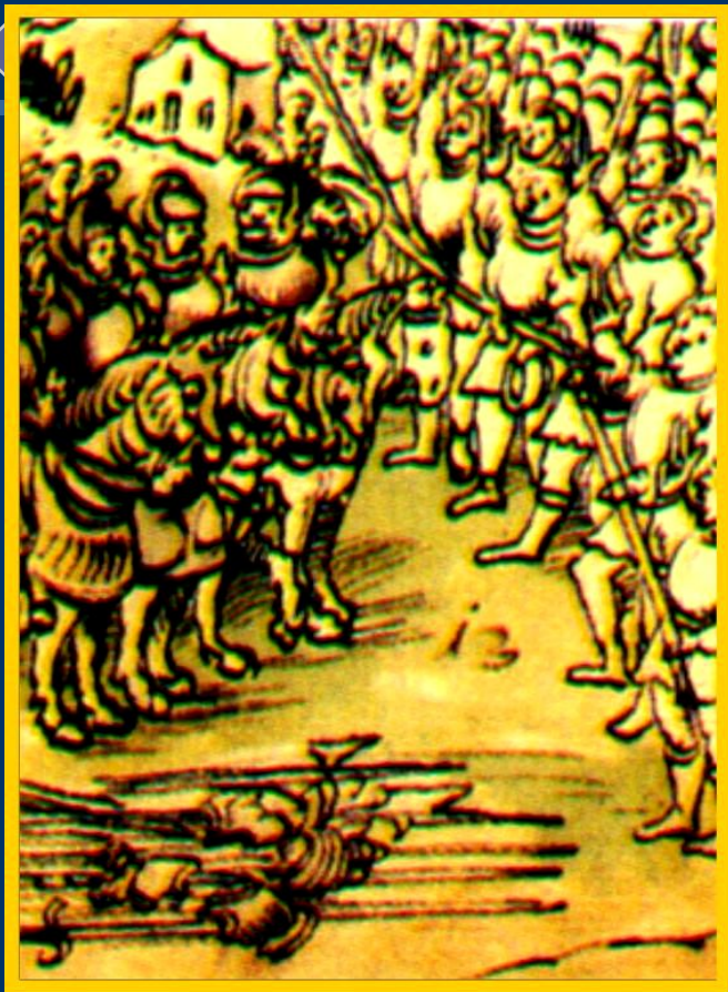
Рыцари против крестьян. Миниатюра 16 в.

В 1524 г. в Германии на-чалась крестьянская война. Восставшие обосновывали свои действия позицией Т. Мюнцера , заявившего, что народ сам будет вершить Божий суд.