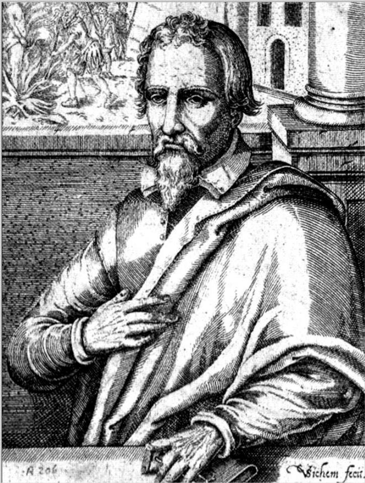
Жан Кальвин. Гравюра 17 в.

В 40-х гг. 15 в. начался второй этап Реформации. Его возглавил Жан Кальвин, выдвинувший идею «божественного предопределения».