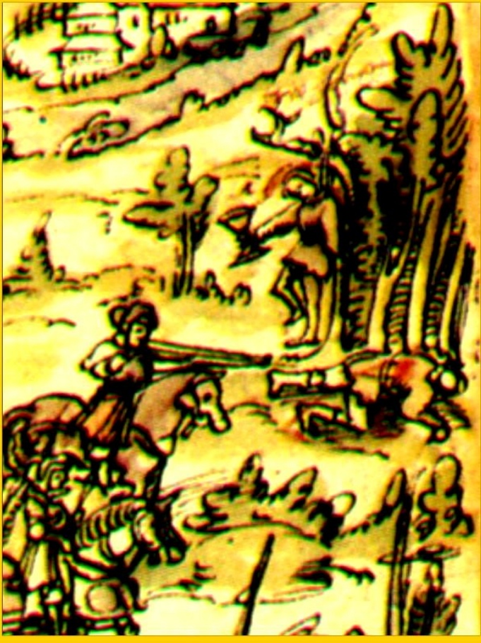
Казнь восставших. Миниатюра 16 в.