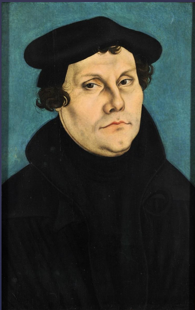
Ма́ртин Лю́тер (1483-1546)