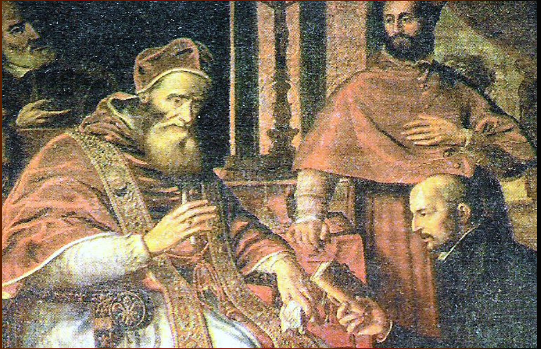
Игнатий Лойола вручает папе Павлу III устав ордена иезуитов.