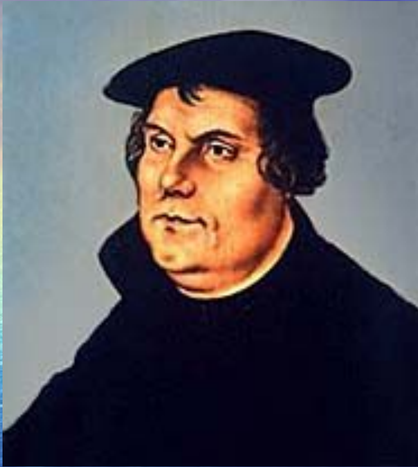
ЛЮТЕР (Luther) Мартин (10 ноября 1483— 18 февраля 1546)