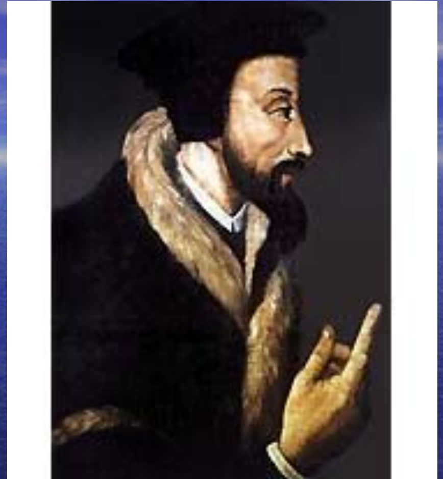
кальвинистская (пресвитерианская) церковь