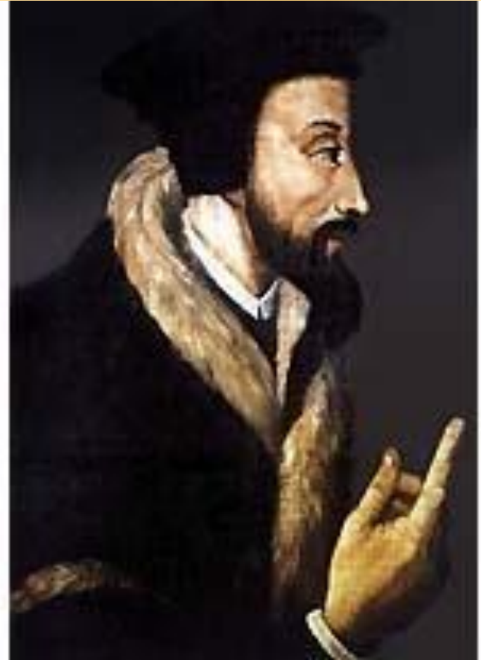
кальвинистская (пресвитерианская) церковь