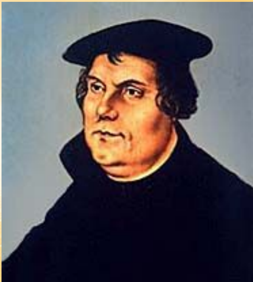
ЛЮТЕР (Luther) Мартин (10 ноября 1483— 18 февраля 1546)