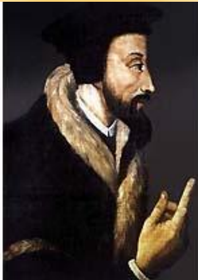
КАЛЬВИН Жан (Calvin) (10 июля 1509 — 27 мая 1564)