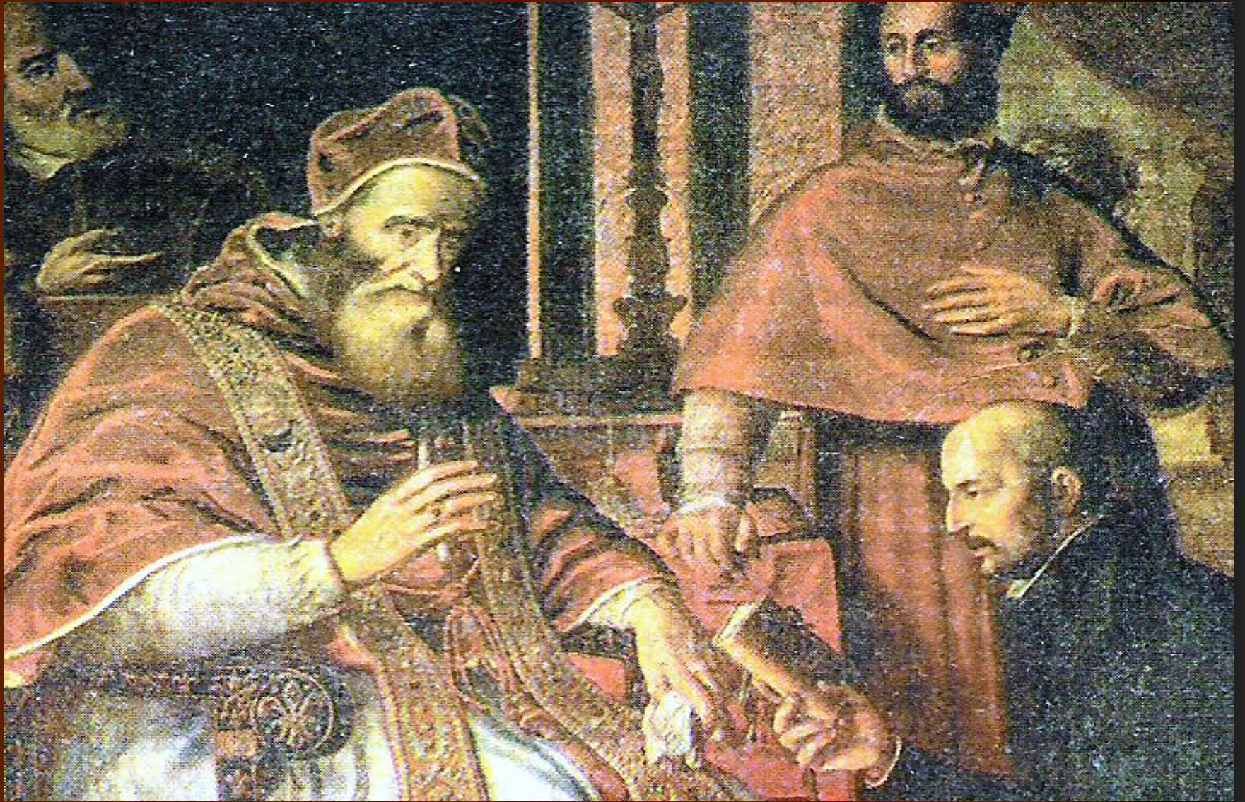
Игнатий Лойола вручает папе Павлу III устав ордена иезуитов.