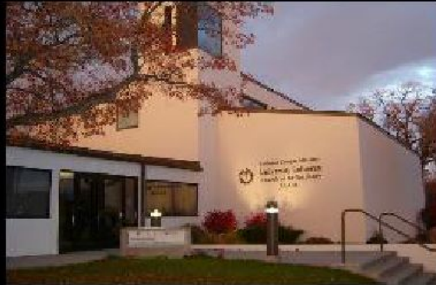
Мартин Лютер – основатель лютеранской церкви

1559 – «Наставление в христианской вере»