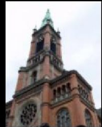
Жан Кальвин – основатель кальвинистской церкви