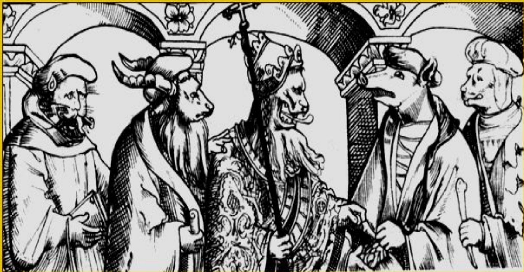
Папа римский и католические богословы