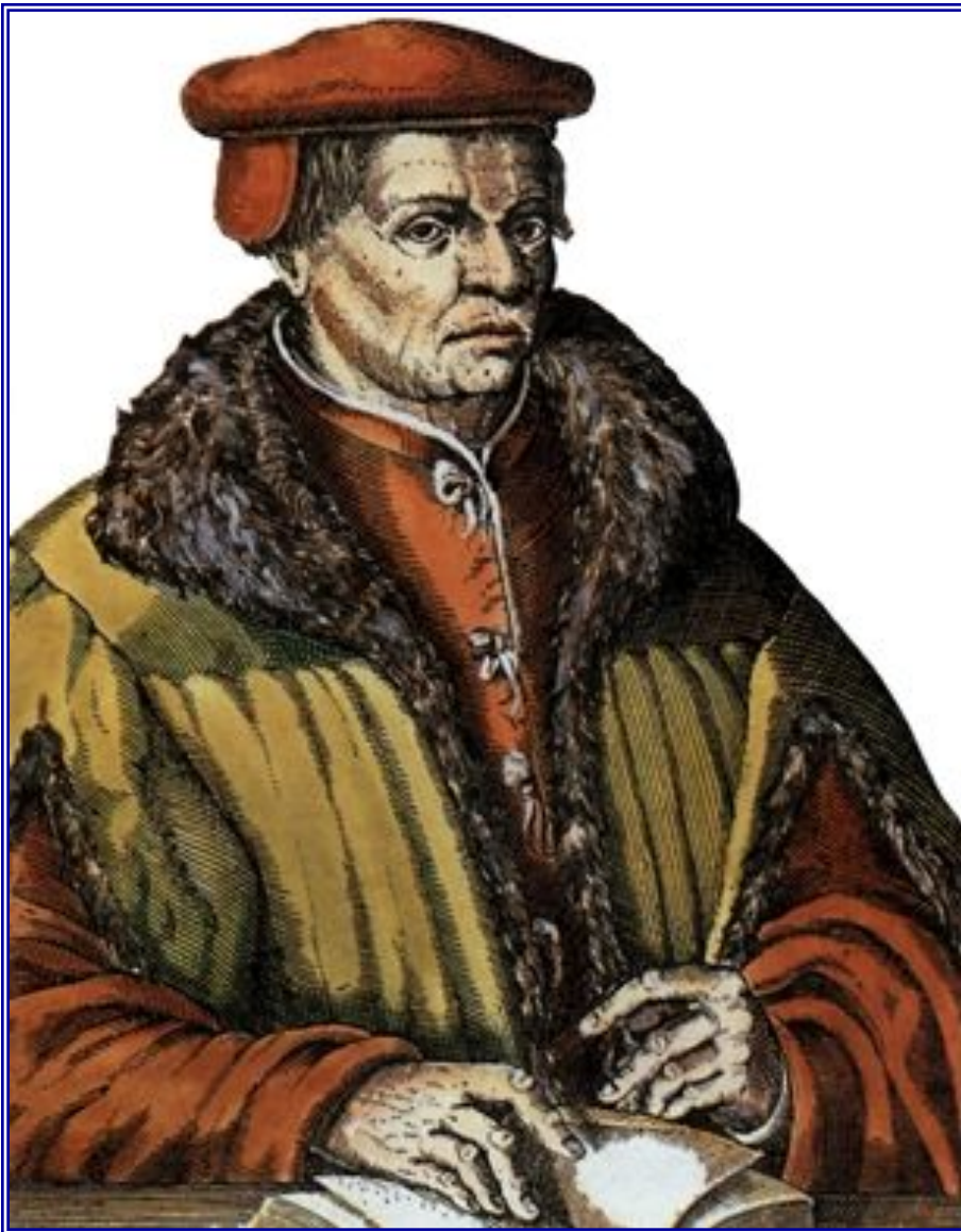
Томас Мюнцер – вождь народной Реформации

1524-1525 гг. – крестьянская война (народная Реформация)