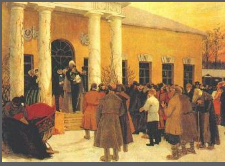
Б.Кустодиев Освобождение крестьян

Размер выкупа должен был сохранить доход помещика от оброка. Он равнялся сумме, которая будучи положенной в банк при 6% годовых, давала доход равный оброку. Крестьянин платил 20%, остальное вносило государство, давая крестьянам ссуду на 49 лет, при этом расчет велся не с крестьянином, а с общиной.