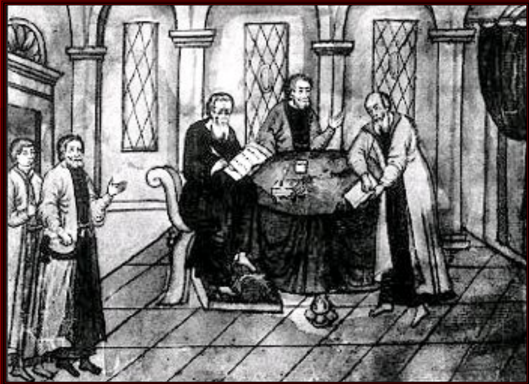
Приказные люди за работой. Рисунок из старинной рукописи.