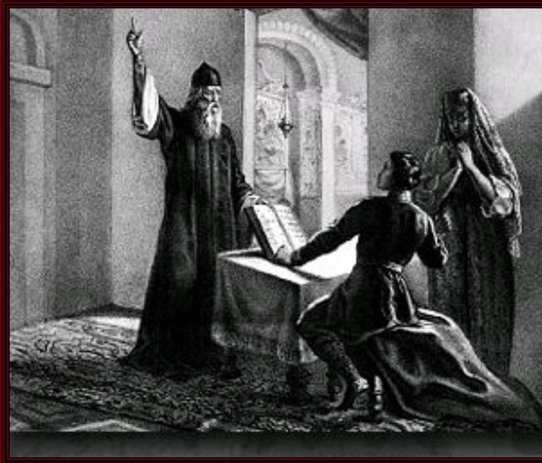
Молодой Иван Васильевич и Сильвестр.

Избранная рада – это кружок, сложившийся вокруг Ивана. В него входили: Д.Курлятаев, А.Курбский, М.Воротынский, Макарий, Сильвестр, И.Висковатый. Возглавлял раду А.Ф. Адашев.