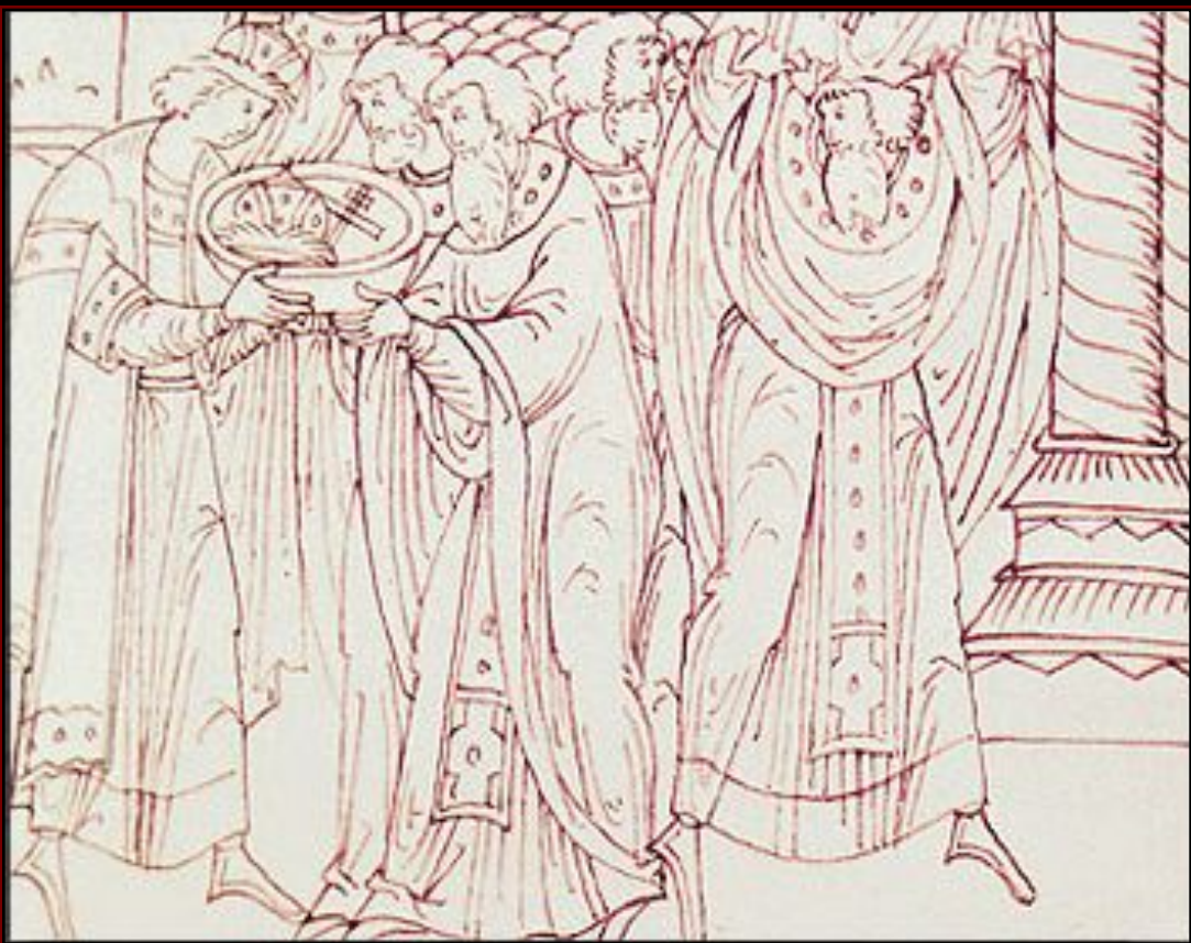
Венчание Ивана IV на царство. Миниатюра из летописи XVI в.

«Земля правиться Божиим милосердием, а последнее нами, государя своими, а не воеводы и судьи»»