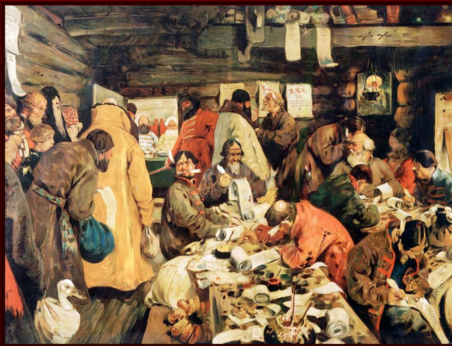
Иванов С.В. «В приказе московских времен»