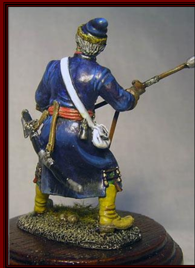
Русский стрелец времен И.Грозного