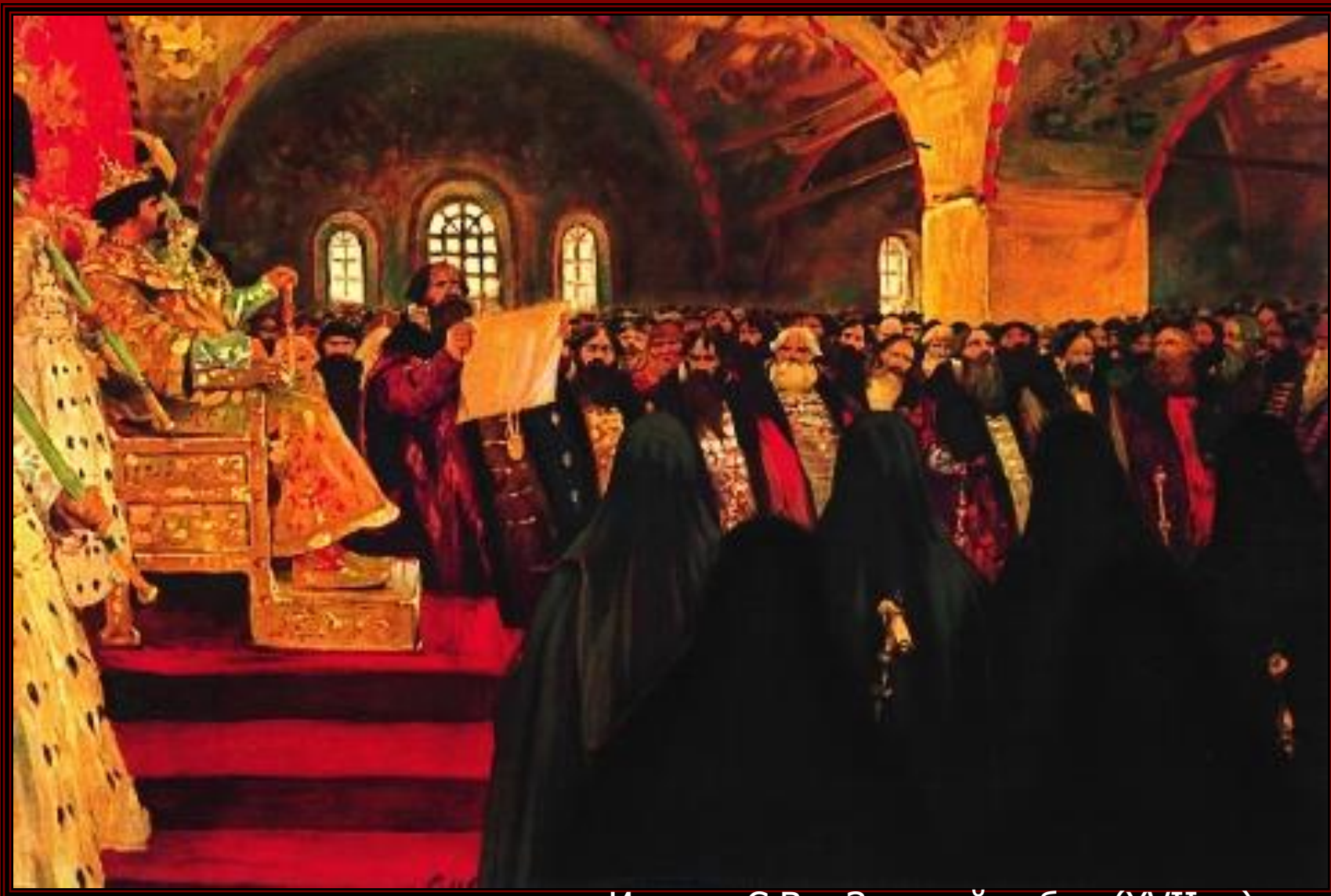
Иванов С.В. «Земский собор (XVII в.)»