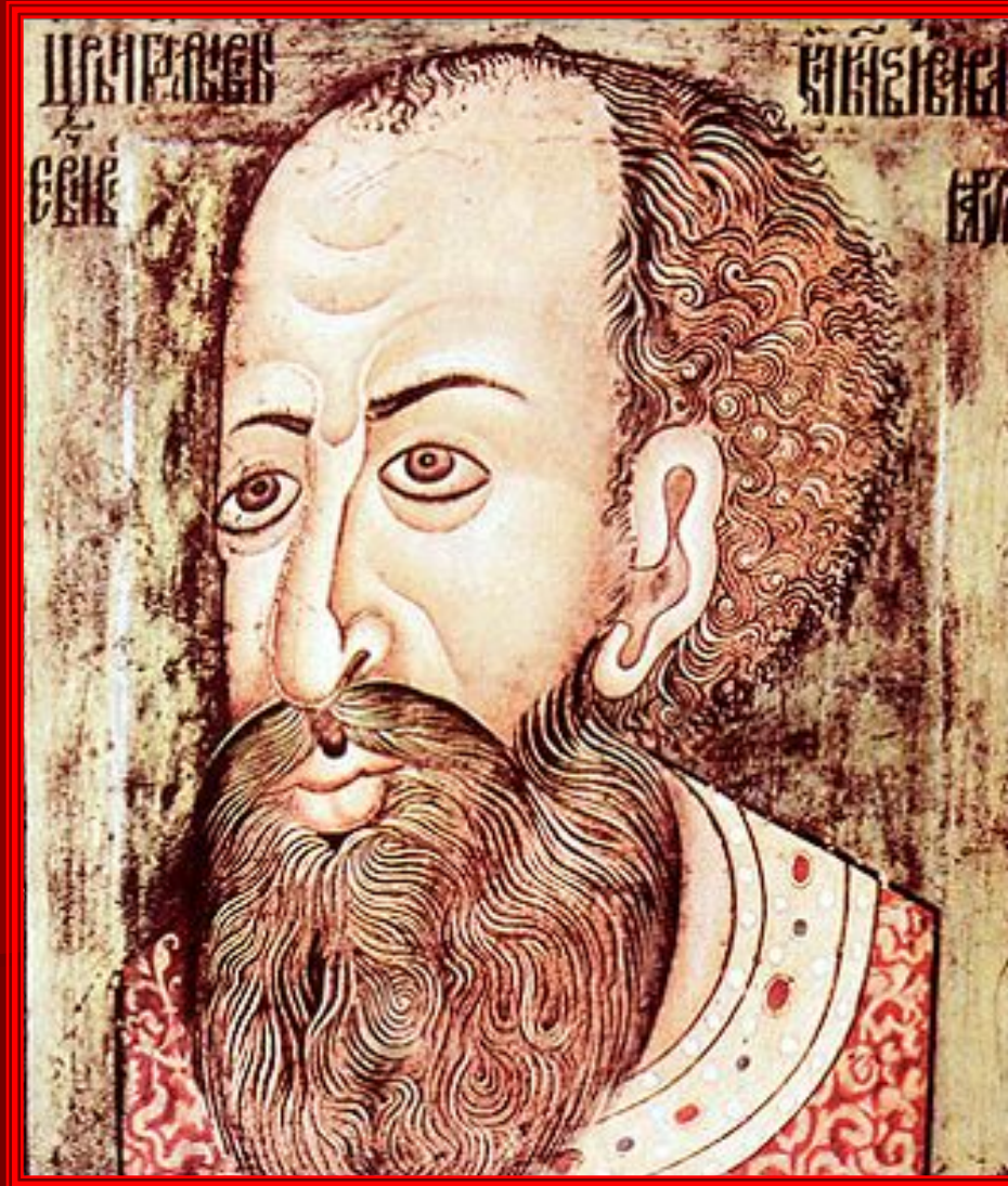
Иван IV. Парсуна. XVI век.