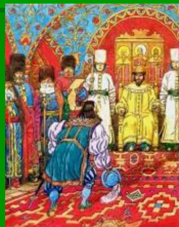
Иван Висковатый , дьяк Посольског о приказа