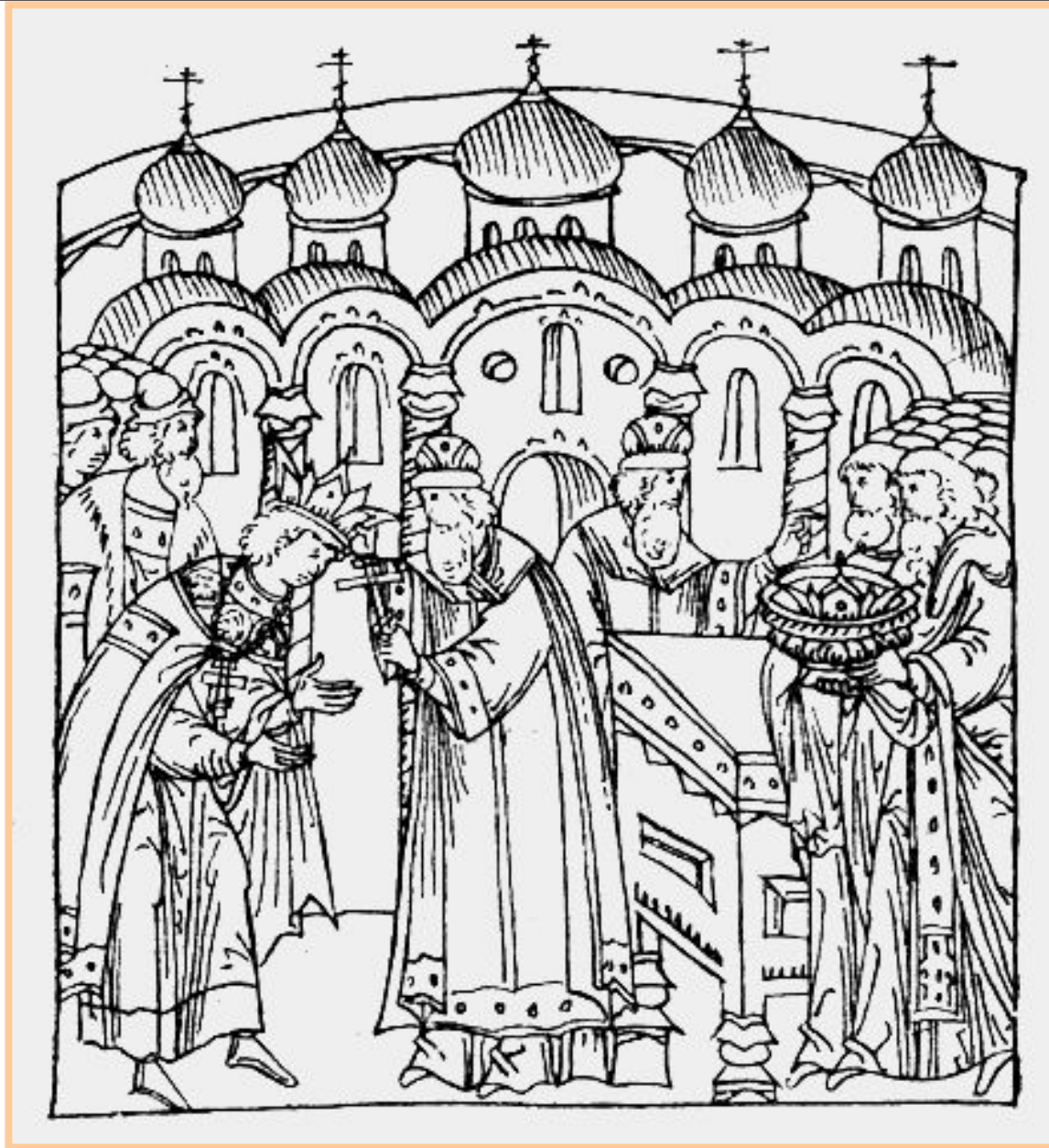
Коронация Ивана Грозного. Фотографическая репродукция